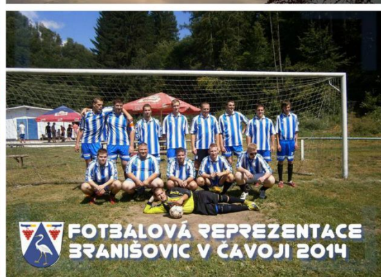
FOTBALOVÁ REPREZENTACE BRANIŠOVIC V ČAVOJI 2014