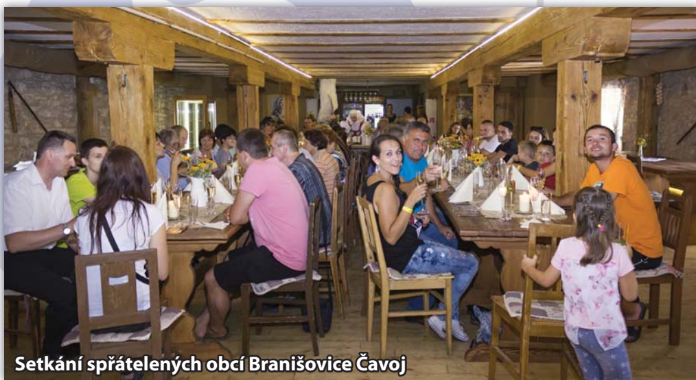
Setkání spřátelených obcí Branišovice Čavoj