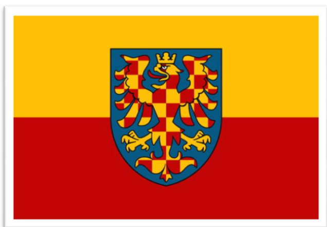
Současná podoba moravské vlajky

Dnešní hojně rozšířená podoba moravské vlajky vychází ze zemských barev, zlaté a červené, kterých se od počátku 19. století používalo k výzdobě, později začaly být vyvěšovány i jako prapory. Oficiálního stvrzení se dočkaly v roce 1848, kdy poslanci Moravského zemského sněmu schválili 5. článek nové moravské ústavy, ve kterém se definuje zemský znak a zemské barvy: „Země moravská podrží dosavadní svůj erb zemský, totiž orlici vpravo hledící, v poli modrém a červenožlutě kostkovanou. Zemské barvy jsou zlatá a červená.“ Od stanovených zemských barev byla následně odvozena moravská vlajka, kterou tvoří dva vodorovné pruhy. Horní pruh je žlutý, spodní je červený. V druhé polovině 19. století a počátkem 20. století, v době vzestupu nacionalismu, to byla právě moravská vlajka, která sjednocovala obyvatelstvo naší země bez ohledu na národnost. Ačkoliv události dvacátého století nebyly pro její užívání příliš příznivé, najdeme o ní doklady za první republiky, po roce 1945 i kolem roku 1968.