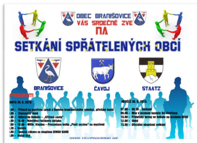
Plakát na setkání