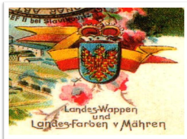
Zemské barvy a znak Moravy, 1900

V letošním roce si připomínáme významné výročí – uplyne 1150 let od příchodu Cyrila a Metoděje k nám na Moravu. Tato událost měla obrovský kulturní a duchovní význam nejen pro naši zem, ale také pro velkou část Evropy. Tuto důležitou událost v našich dějinách si připomeneme vyvěšením moravské vlajky.