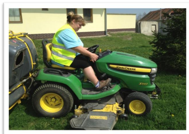
John Deere v akci

V minulém čísle jsme informovali o sběru papíru pro ZŠ v Olbramovicích. Tímto děkujeme všem občanům, kteří se akce aktivně zúčastnili.