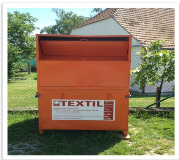
Kontejner na použité oděvy u budovy OÚ

Tyto kontejnery budeme pravidelně kontrolovat a vyvážet tak, aby nedocházelo k jejich přeplňování. Pro případ nějakých problémů bude na každém kontejneru uvedeno telefonní číslo – horká linka – na zavolání budeme situaci okamžitě řešit i mimořádným svozem. Rádi bychom umožnili solidárním občanům, kteří jsou i ve vaší obci, aby mohli šatstvo, které sami již nepotřebují, věnovat potřebným. Šatstvo ze sbírek po vyřízení v našem středisku v Brně, Rosická 1, slouží pro výdej lidem v nouzi a sociálně potřebným.