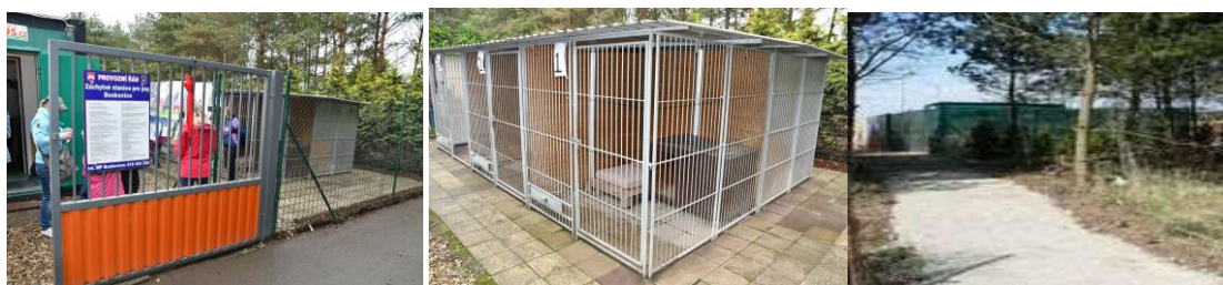
Záchytná stanice pro psy Boskovice

Informace o nalezených a umístěných psech jsou pravidelně zveřejňovány na facebookovém profilu městské policie a webu Psí záchytné stanice Boskovice (psiboskovice.cz). Za profesionální přístup patří poděkování správce stanice Adéle Adámkové a dobrovolníkům, kteří pomáhají se zajištěním péče, například venčením. V roce 2024 byla také organizována sbírka materiální pomoci (krmivo, hračky a další potřeby), jejíž výtěžek zlepšil podmínky v útulku.