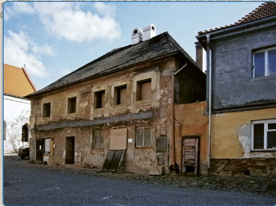
Ulice U Templu – rekonstrukce domu, v jehož sklepě je zpřístupněna mikve (2019)