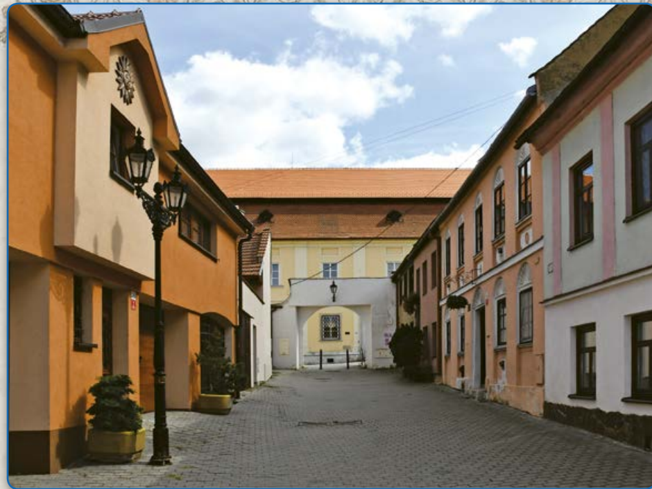
Plačkova ulice – brána do židovské čtvrti (2019)