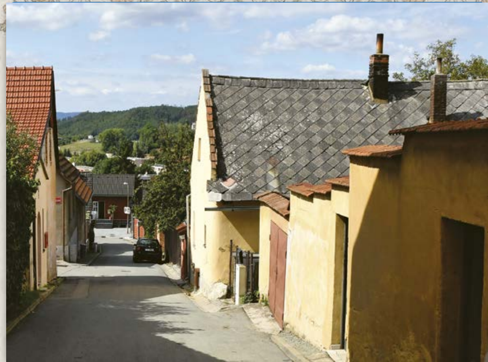
Joštova ulice (2019)