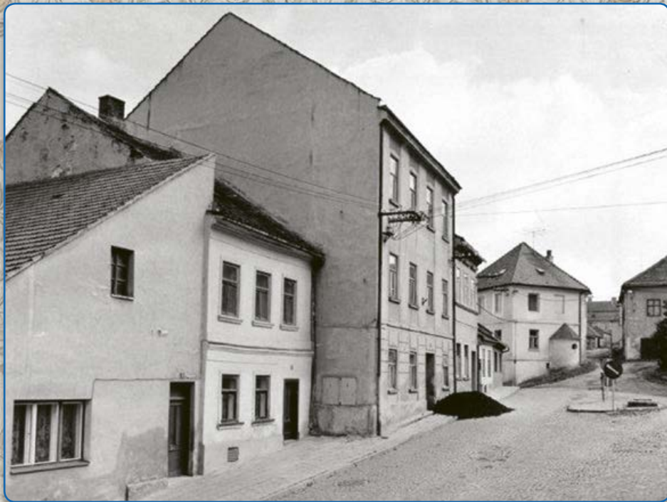
Ulice U Vážné studny