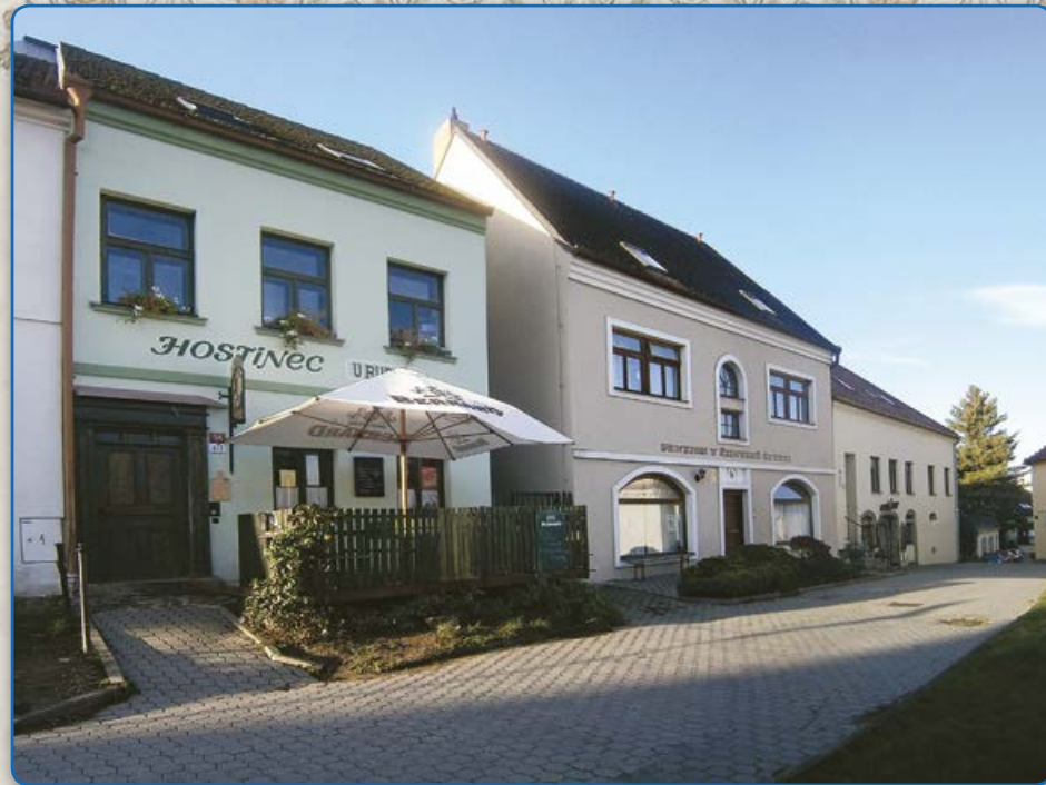
Plačková ulice (2019)