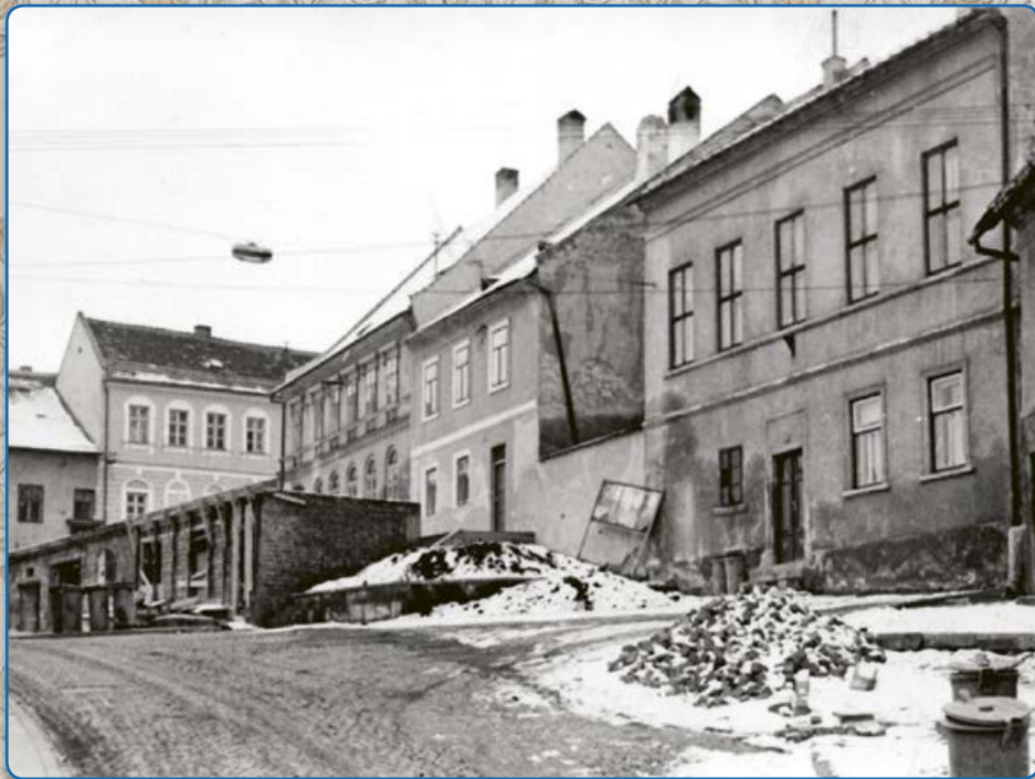
Bývalé masné krámy v ulici U Vážné studny