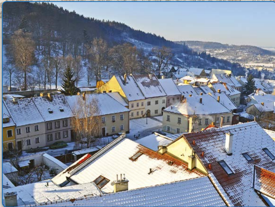
Pohled na část židovské čtvrti z radniční věže (2012)