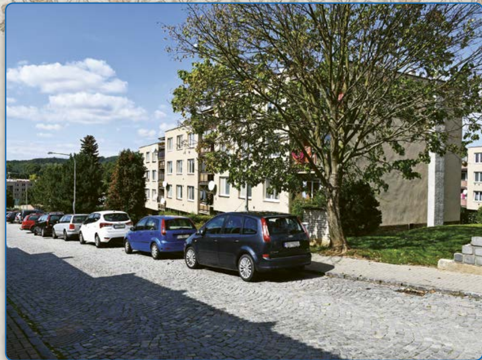
Bílkova ulice (2019)