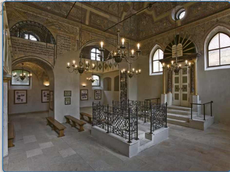
Synagoga maior po rekonstrukci (2008)