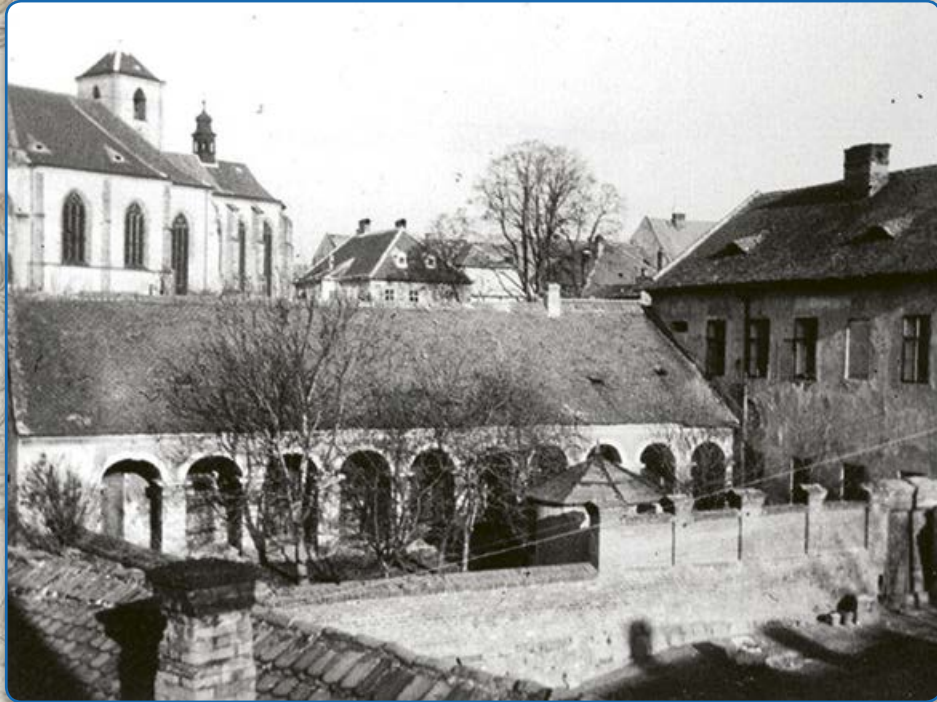
Židovské lázně v ulici U Koupadel