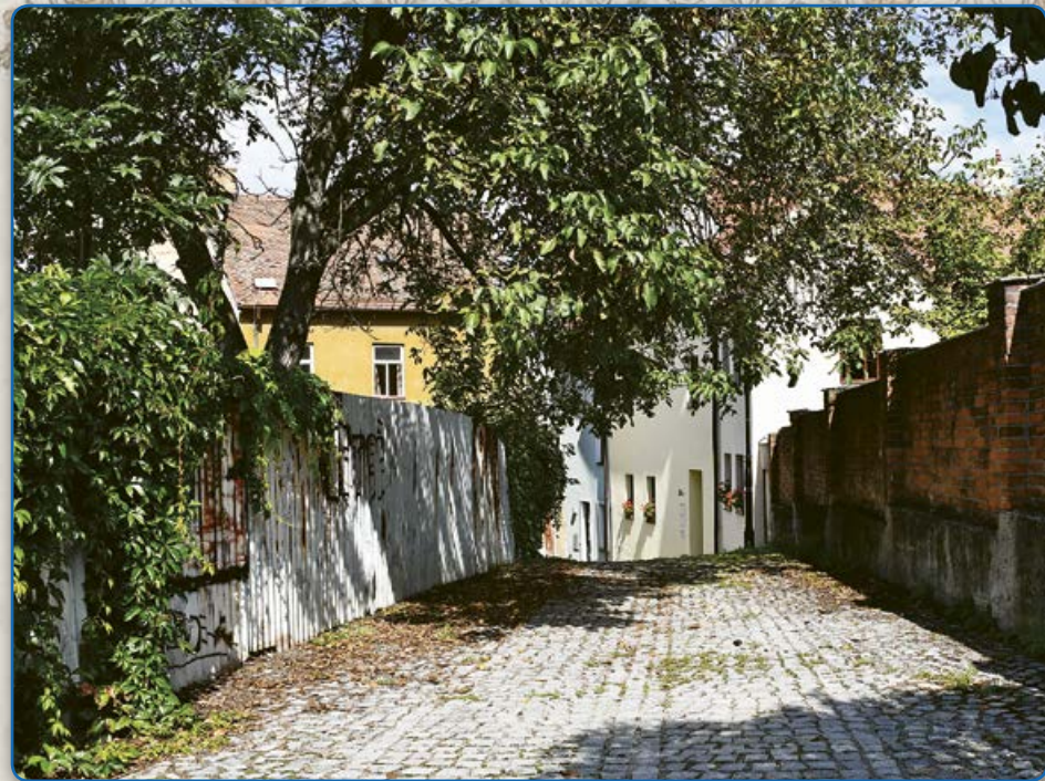
Špitálek – pohled z Joštovy ulice (2019)