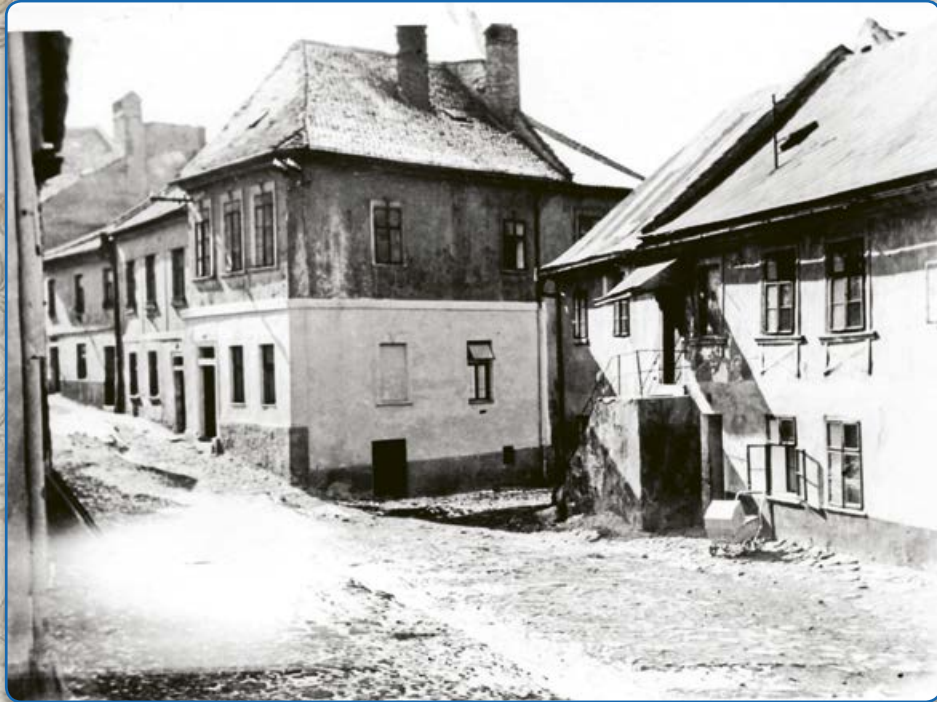
Ulice U Templu