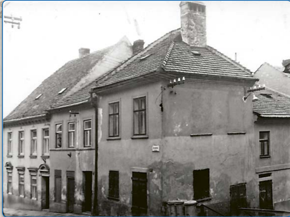
Domy na rohu ulic U Templu a Bílkova