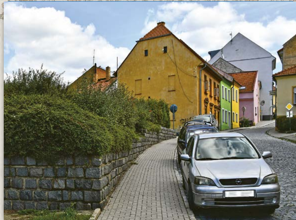
Bílková ulice – naproti bývalému židovskému obecnímu domu (2019)