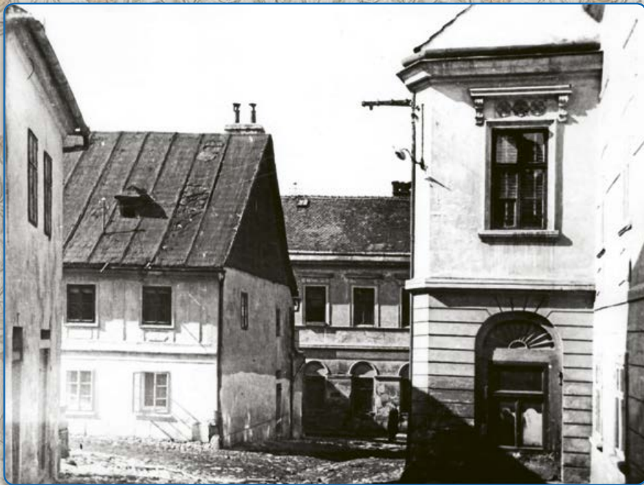
Ulice U Koupadel