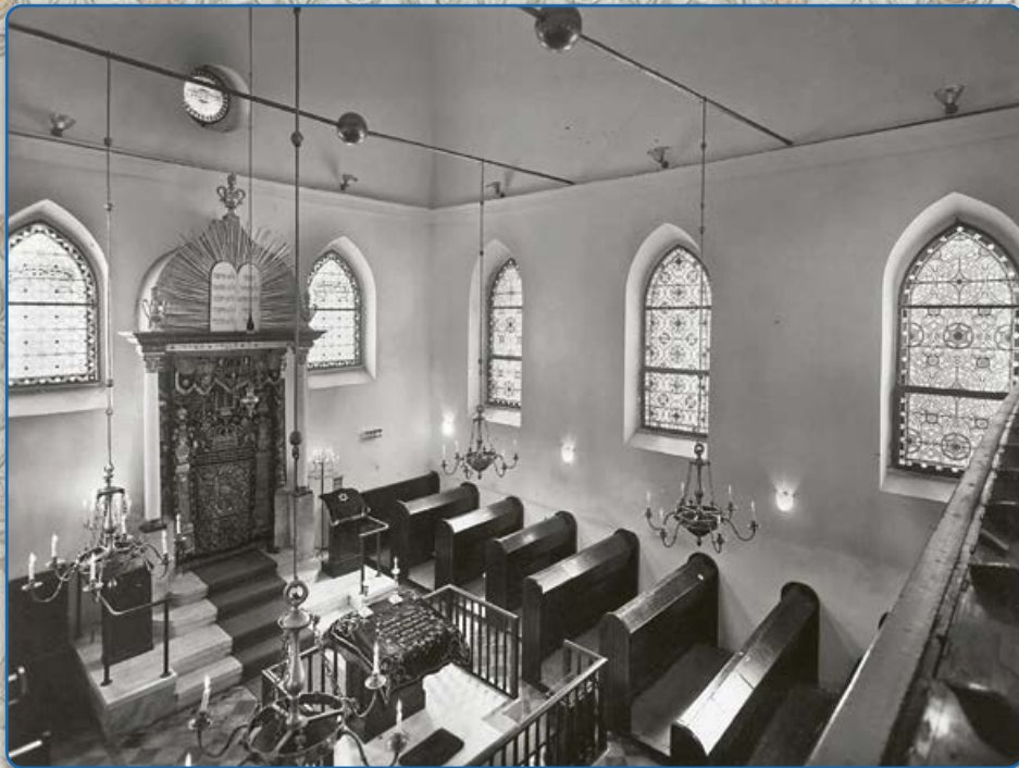
Interiér synagogy maior (kolem roku 1935)