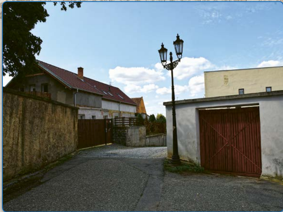
Ulice Pod Klášterem (2019)