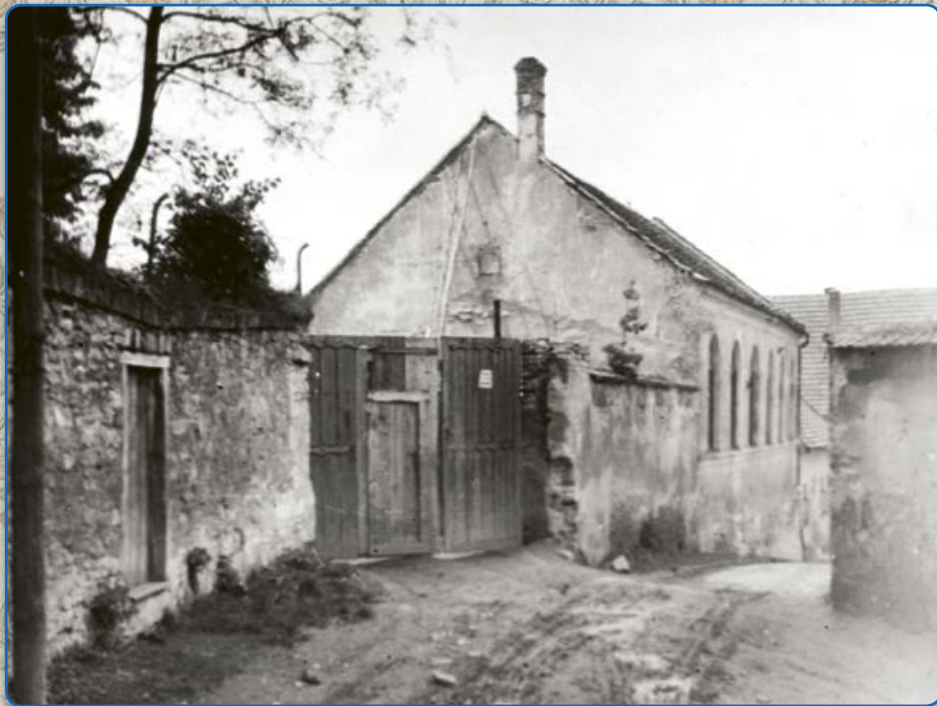
Tělocvična spolku Makkabi stála na konci ulice Pod Klášterem