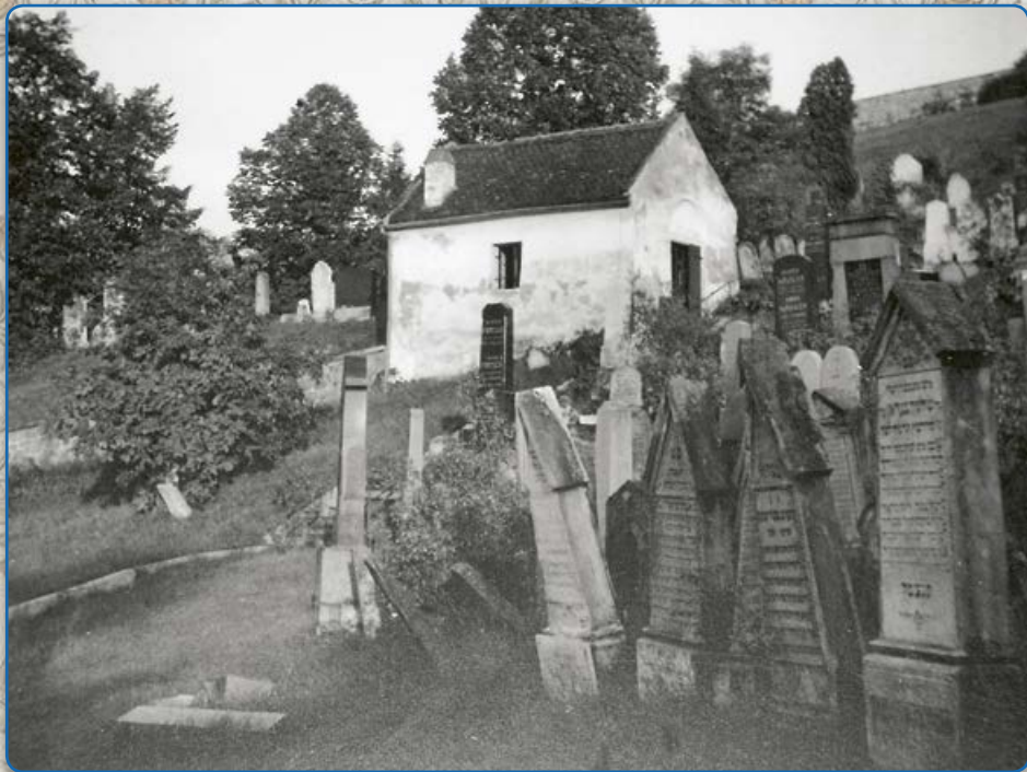
Původní márnice na židovském hřbitově (20. – 30. léta 20. stol.)