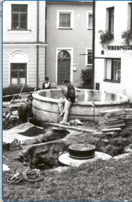
Kašna v ulici U Koupadel (90. léta 20. stol.)