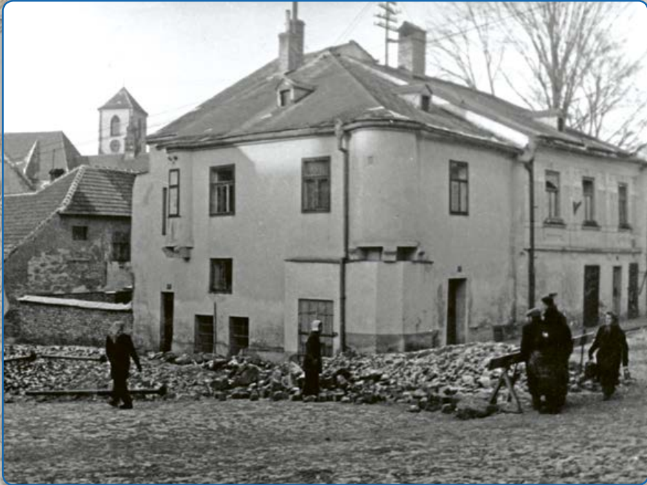
Dům na rohu ulic Ant. Trapla a Zborovská (50. léta 20. stol.)