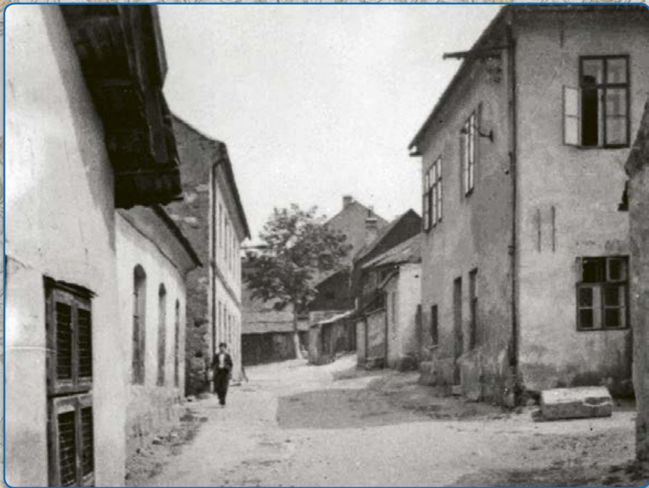
Ulice v židovské čtvrti