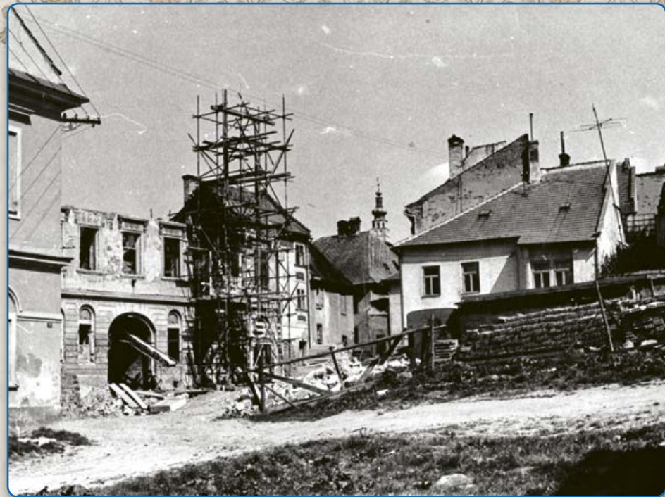
Rekonstrukce domu v ulici U Koupadel 6 (60. léta 20. stol.)