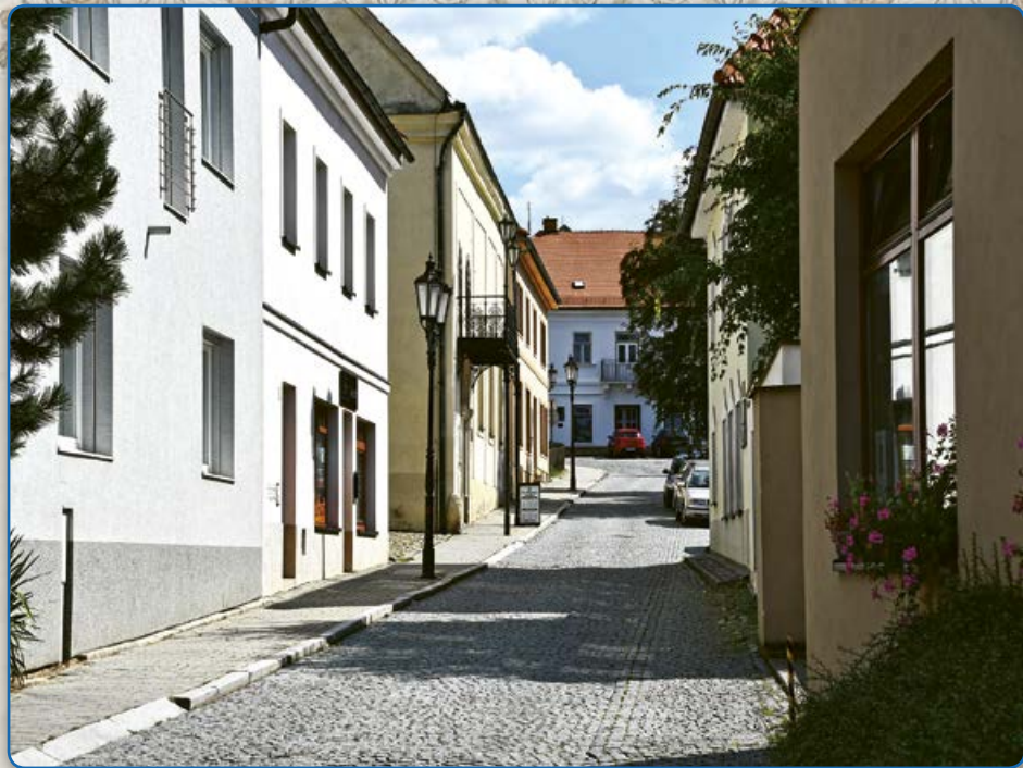
Proměny ulice Ant. Trapla (2019)