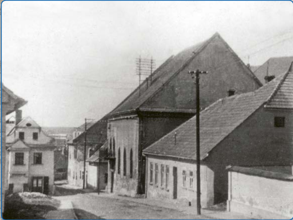
Synagoga maior na ulici Ant. Trapla