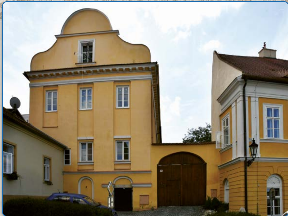
Bílkova ulice (2019)