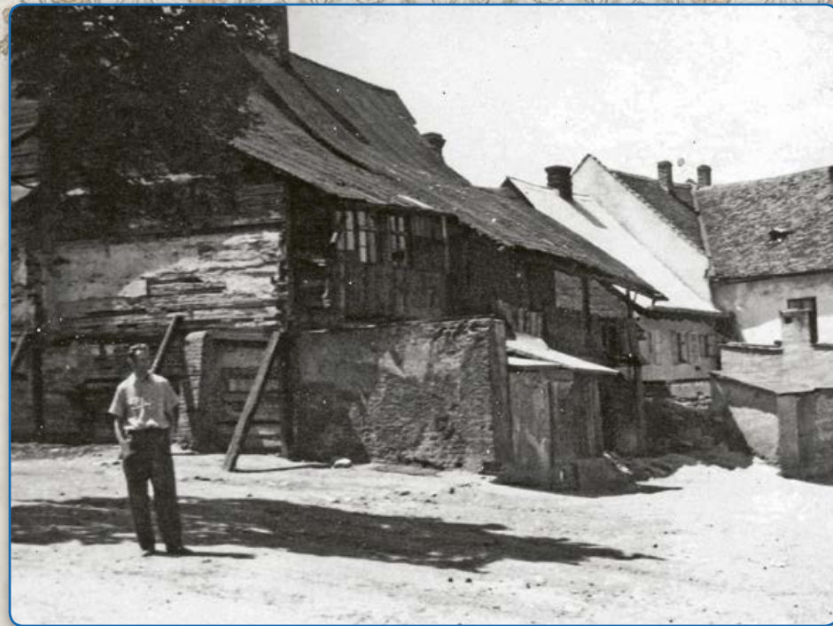
Zadní části domů na ulici Bílkova – pohled z ulice U Koupadel