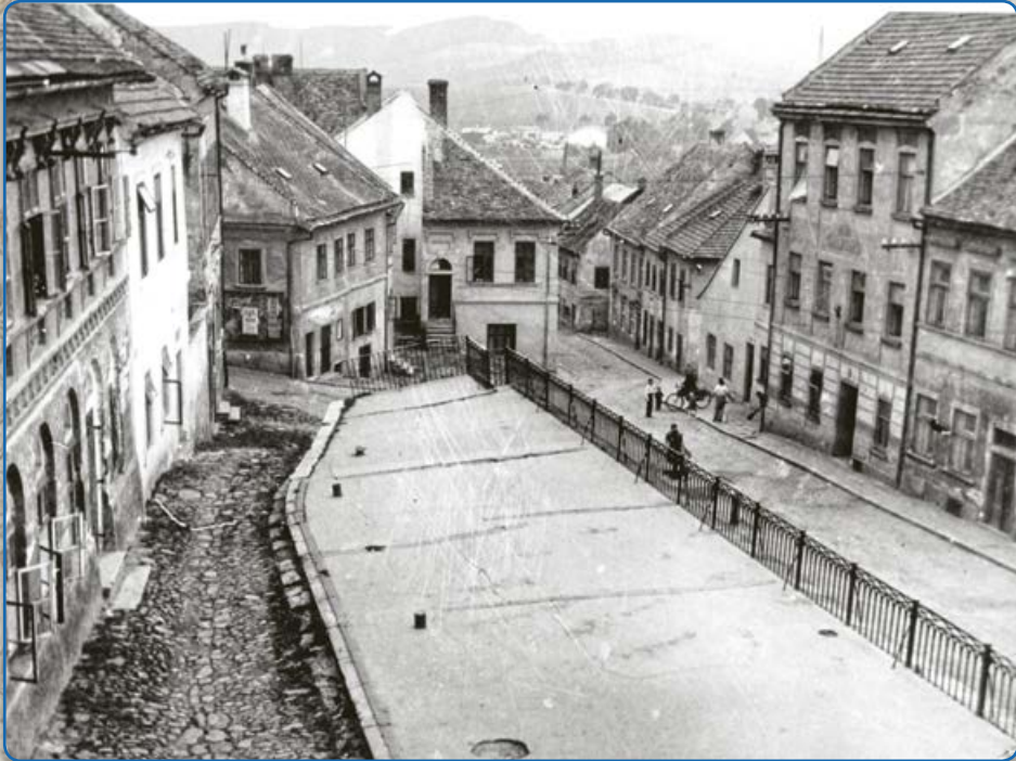
Terasa nad masnými krámy v ulici U Vážné studny