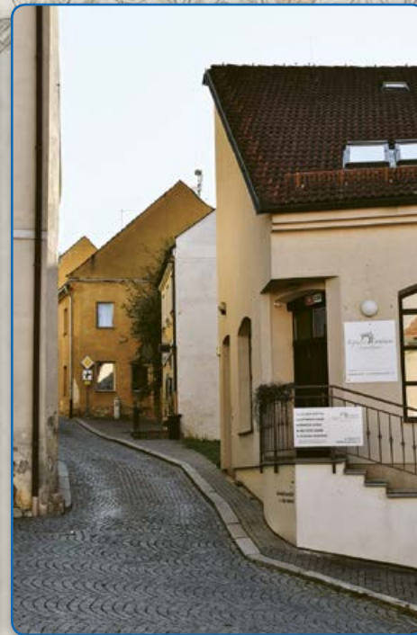
Proměny ulice Velenovy (vpravo 2019)