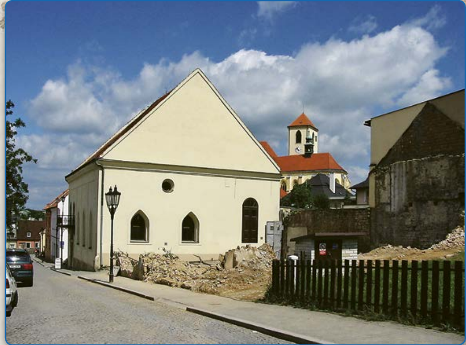
Synagoga maior na ulici Ant. Trapla (2009)