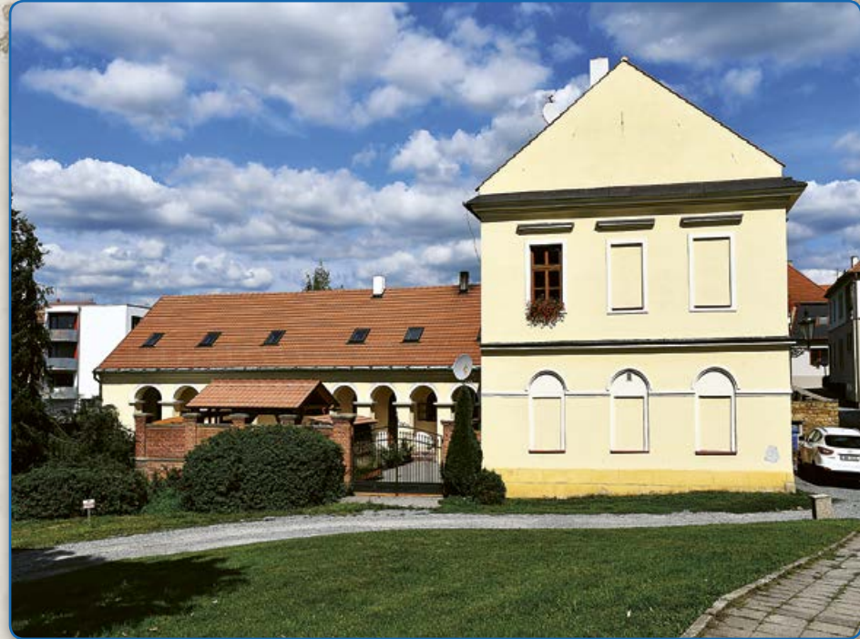
Bývalé židovské lázně (2019)