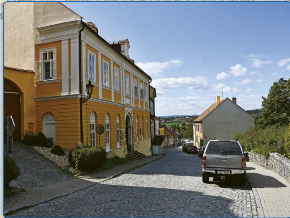
Bílkova ulice – vlevo budova bývalého židovského obecního dom (2019)