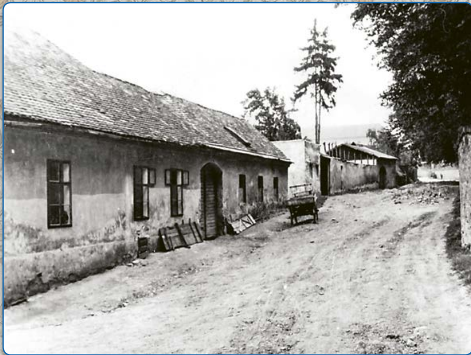
Ulice Pod Klášterem