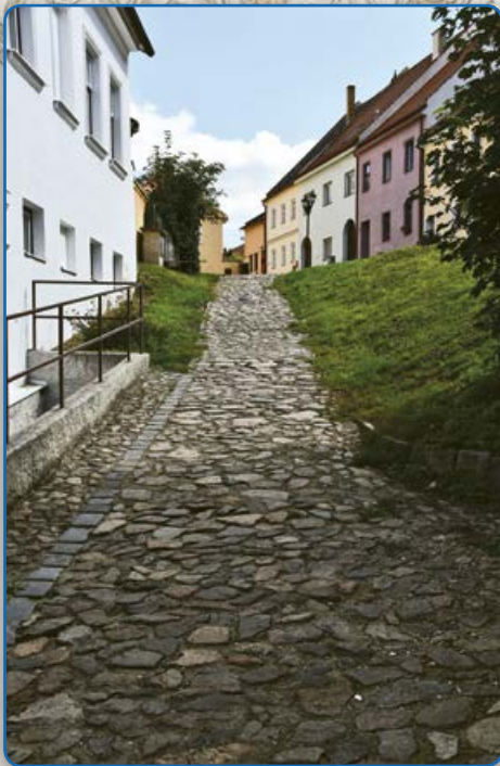
Spojovací cesta mezi ulicemi Zborovská a Plačkova