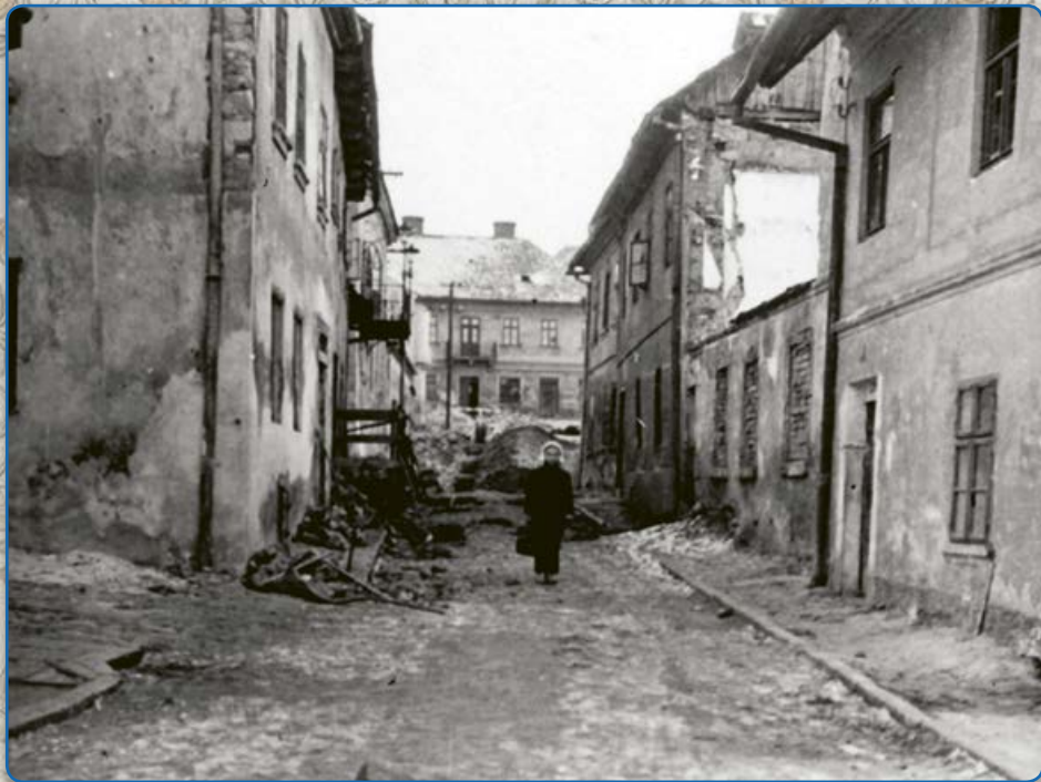
Proměny ulice Ant. Trapla