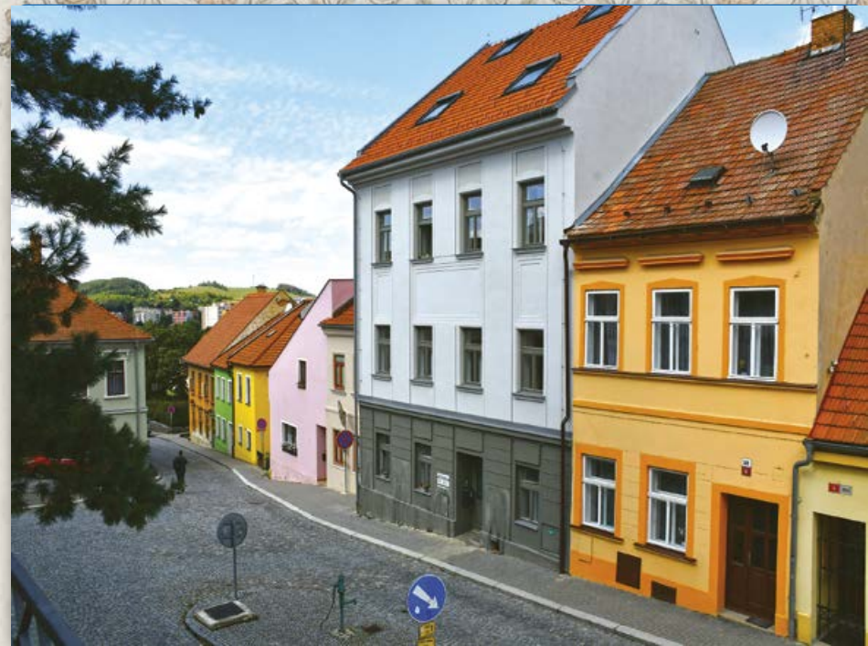
Nově opravené domy v ulici U Vážné studny (2019)