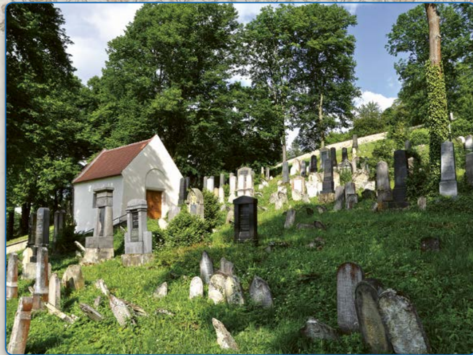
Židovský hřbitov s opravenou márnicí (2016)