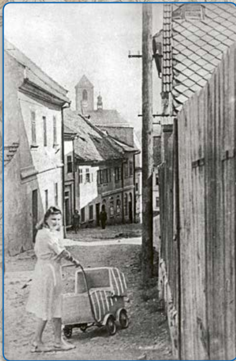
Proměny ulice Velenovy (vpravo 2019)