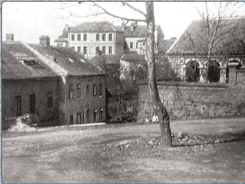
Ulice U Koupadel – v pozadí školní budova