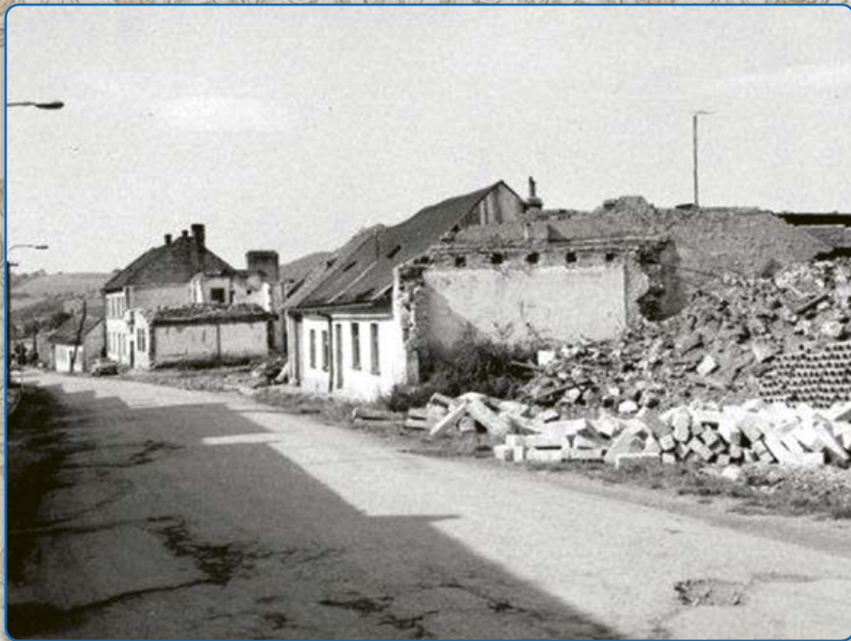
Bílkova ulice – bourání původních domů (70. – 80. léta 20. stol.)