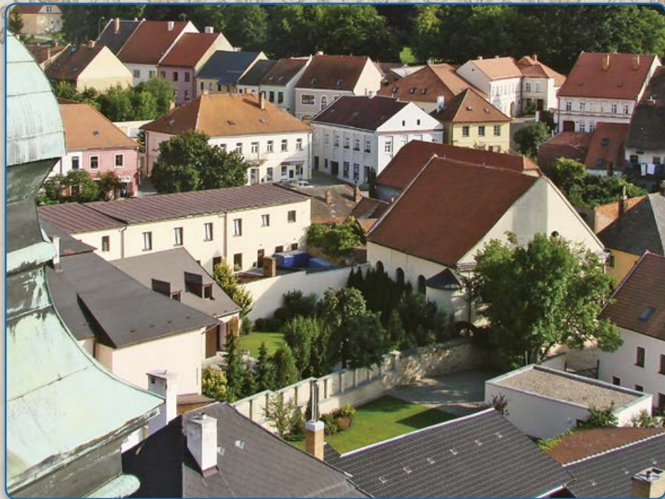
Pohled z věže kostela na zahradu za synagogou maior (2008)