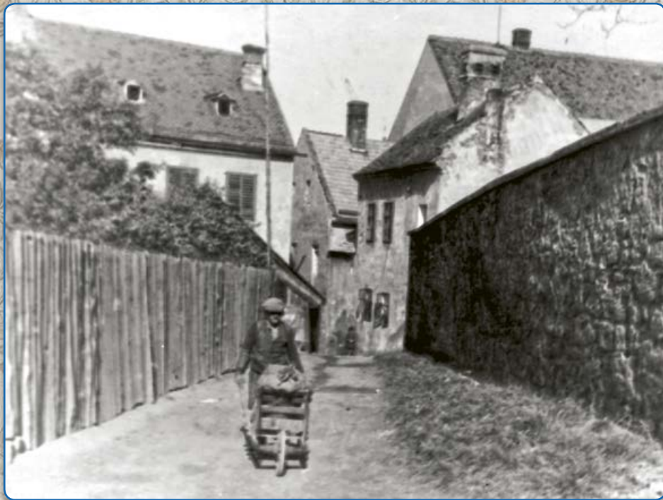
Špitálek – pohled z Joštovy ulice