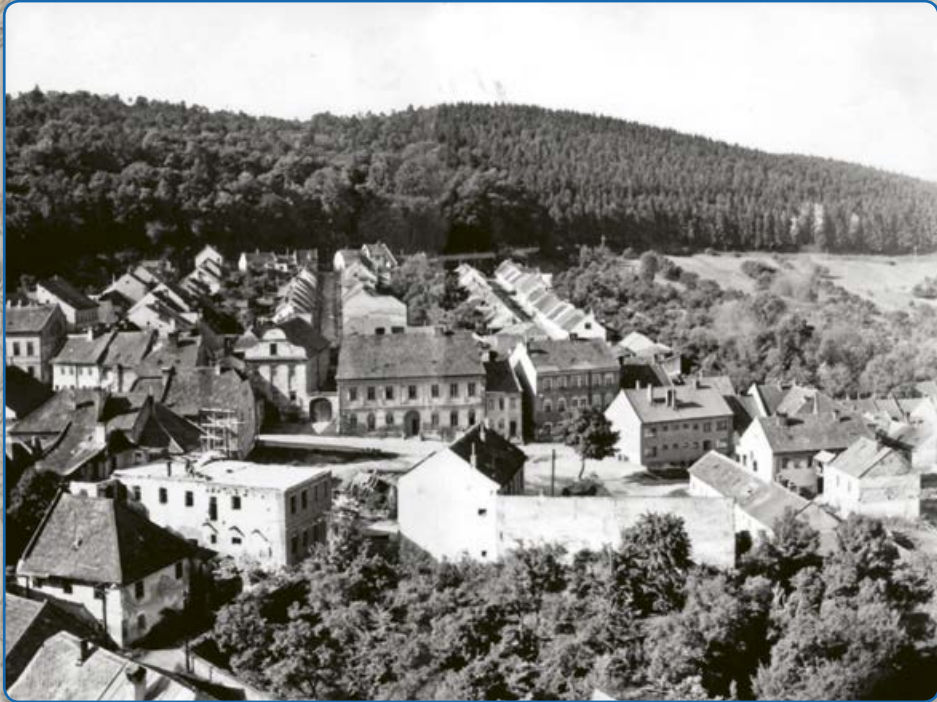
Pohled na část židovské čtvrti z věže kostela (kolem roku 1970)