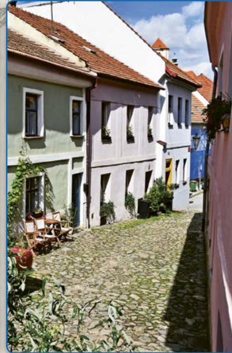
Ulice U Templu (2014 a 2018)