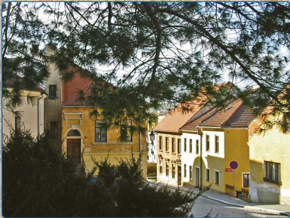
Domy na ulici U Vážné studny a Bílkova (2007)