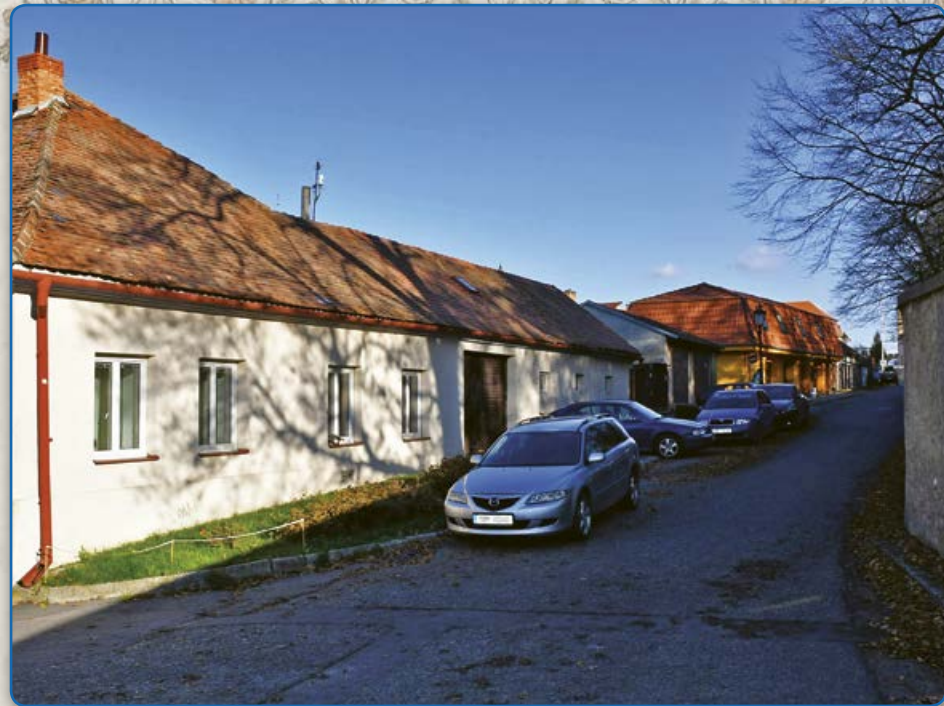
Ulice Pod Klášterem (2019)