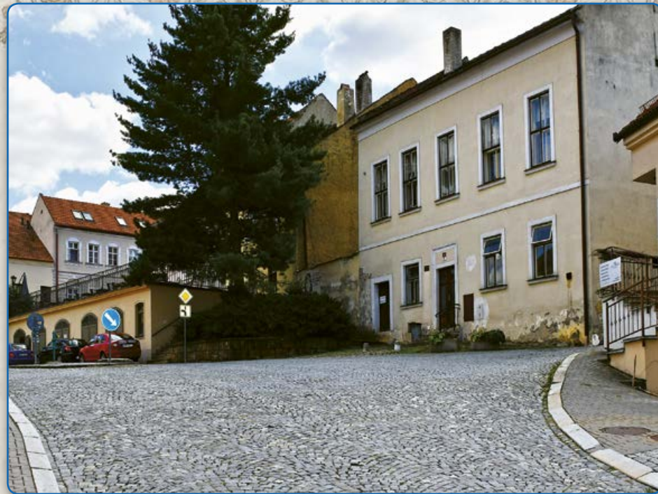
U Vážné studny – pohled z Bílkovy ulice (2019)