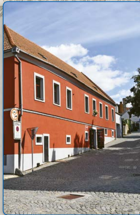
Ulice U Císařské (1986 a 2019)