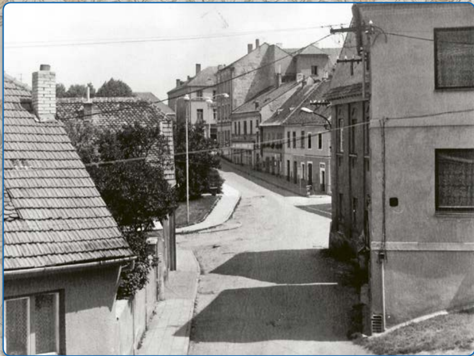
Zborovská ulice – pohled z ulice U Vážné studny (1992)