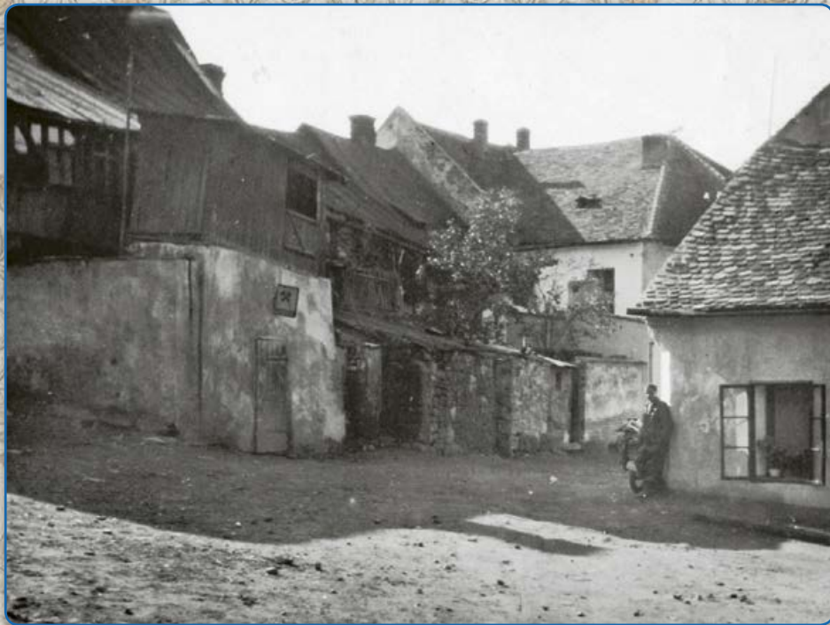
Zadní části domů na ulici Bílkova – pohled z ulice U Koupadel