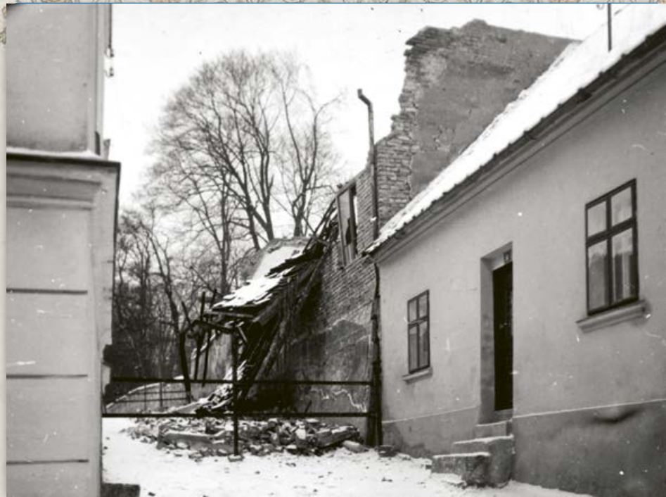
Ulice Pod Klášteřem – bourání tělocvičny spolku Makkabi