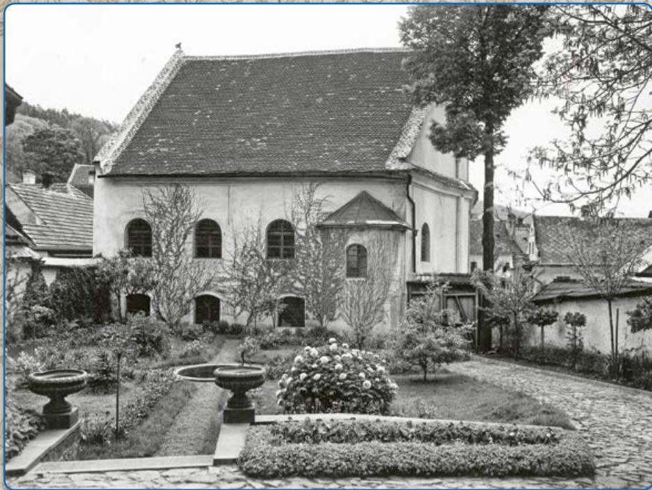
Zahrada u synagogy maior (kolem roku 1935)