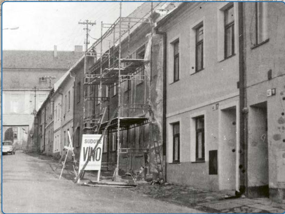
Plačková ulice (1993)