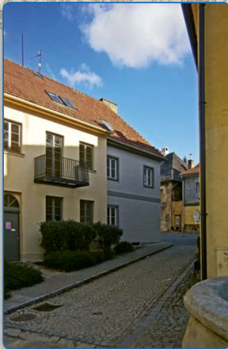
Ulice U Koupadel a U Templu (foto vpravo 2019)