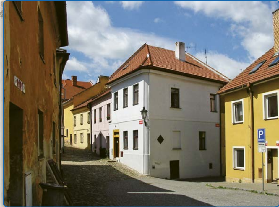
Ulice U Templu – vlevo dům s žid. rituální lázní – mikve (2009)