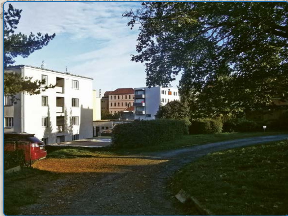
Ulice U Koupadel – v pozadí budova Střední pedagogické školy Boskovice (2019)