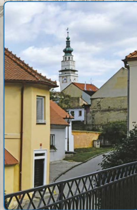
Pohled z terasy U Vážné studny