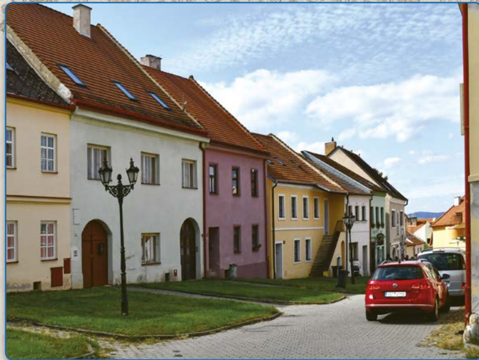
Plačková ulice (2019)