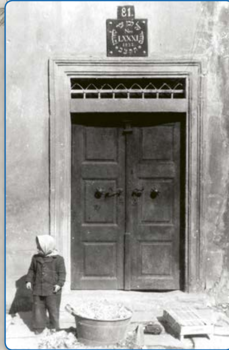
Život v židovské čtvrti