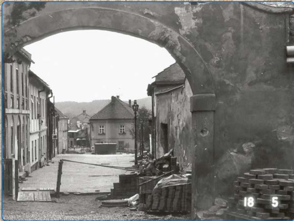
Jediná zachovalá brána do židovské čtvrti (18. 5. 1994)