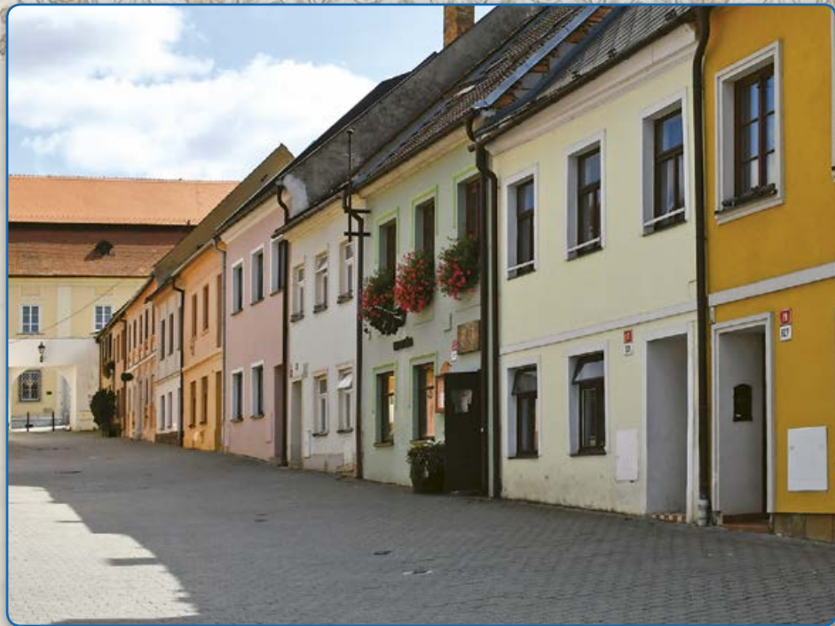
Plačková ulice (2019)