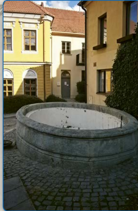
Kašna v ulici U Koupadel (2019)