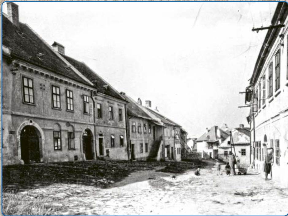
Plačková ulice (kolem r. 1920)