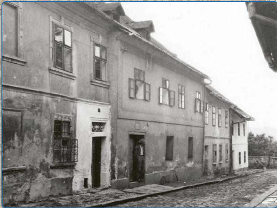
Ulice Ant. Trapla – vlevo vstup do bývalé synagogy minor