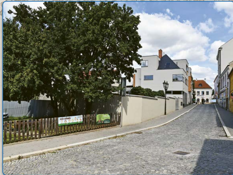
Ulice Zborovská (2019)