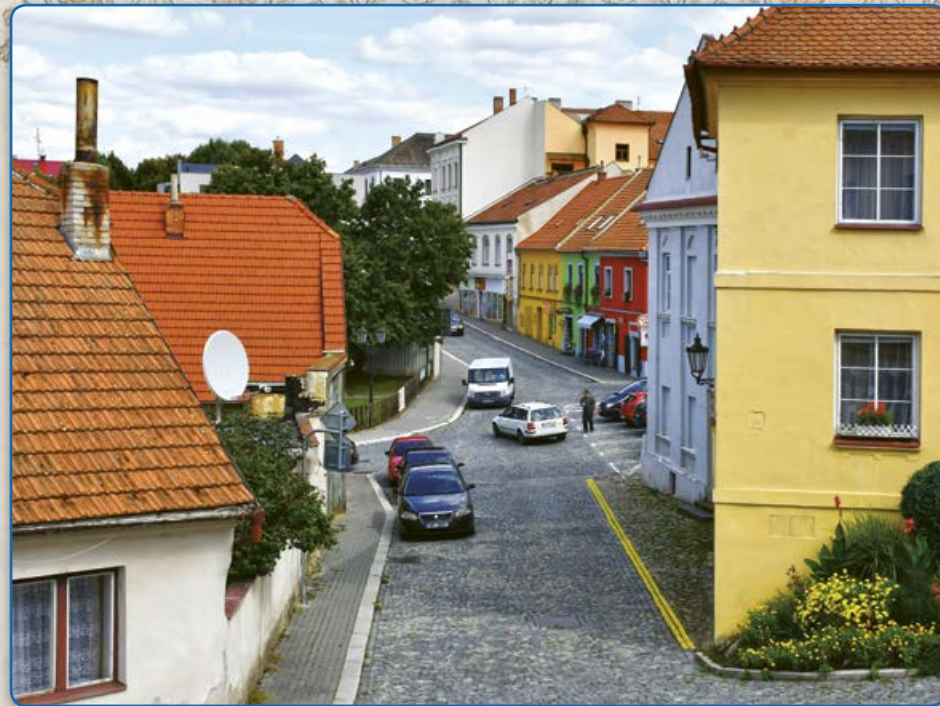
Zborovská ulice – pohled z ulice U Vážné studny (2019)