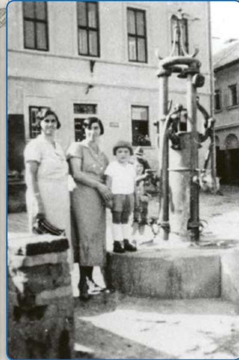
U Vážné studny – zařízení na vážení vody