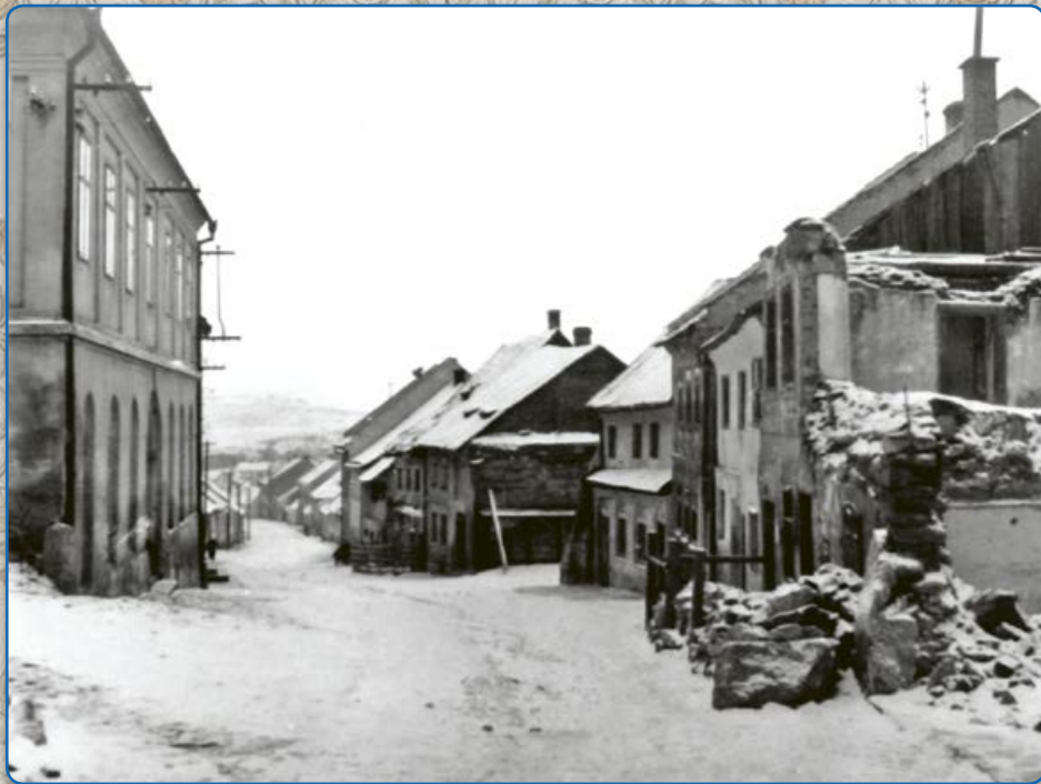
Bílkova ulice – bourání původních domů