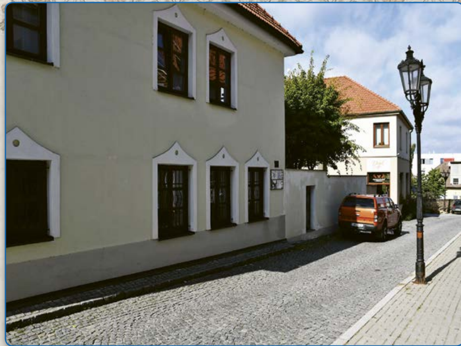
Nové domy na ulici Ant. Trapla (2019)