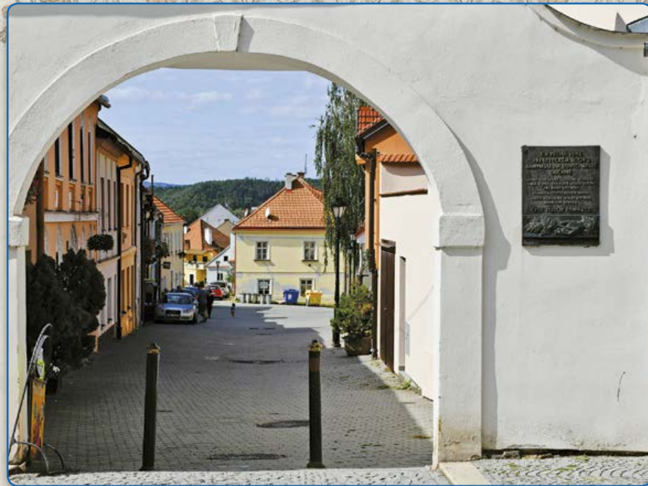
Jediná zachovalá brána do židovské čtvrti (2019)