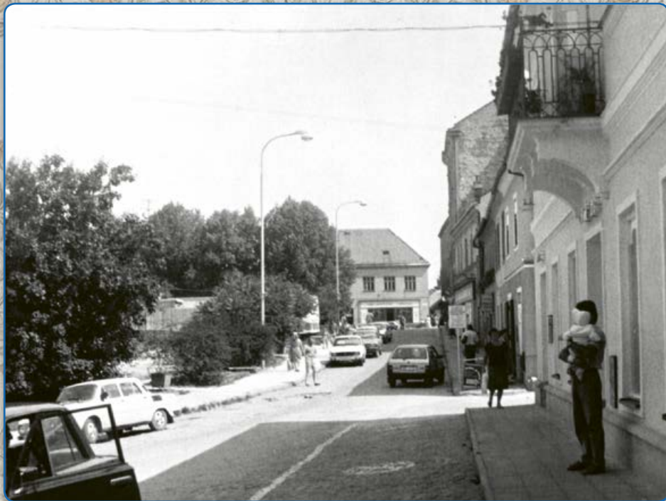
Ulice Zborovská (1992)