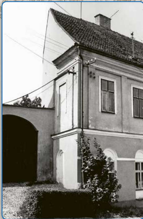
Bílkova ulice – vlevo bývalá továrna na výrobu obuvi Popper, vpravo bývalý židovský obecní dům