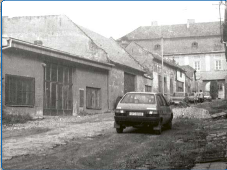
Plačková ulice (80. – 90. léta 20. století)