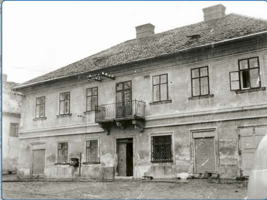
Ulice Zborovská – rodný dům spisovatele Hermanna Ungara