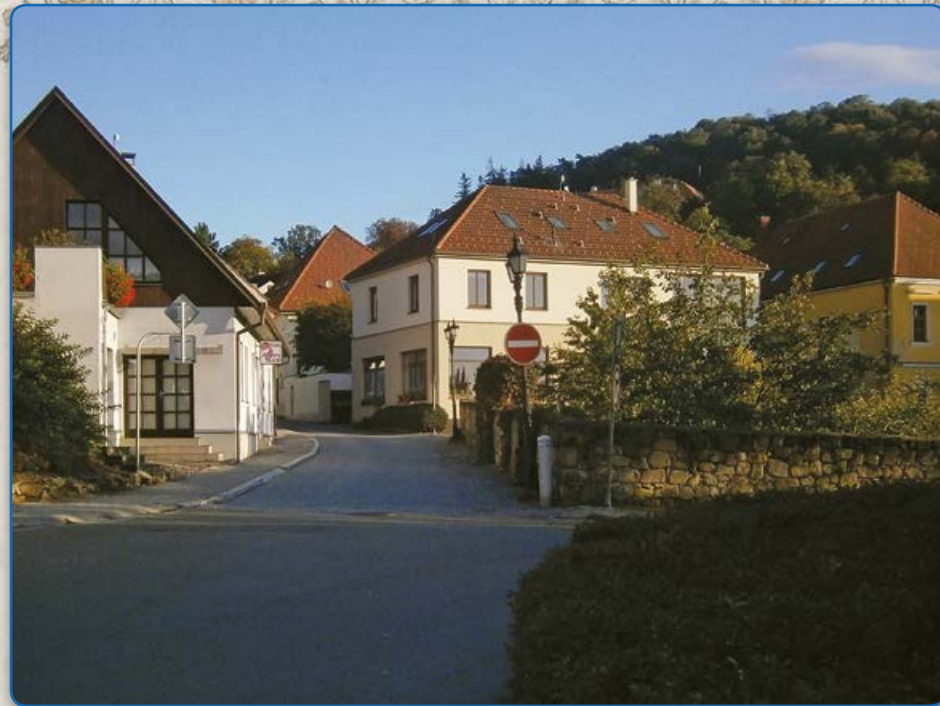
Ulice Ant. Trapla (2019)