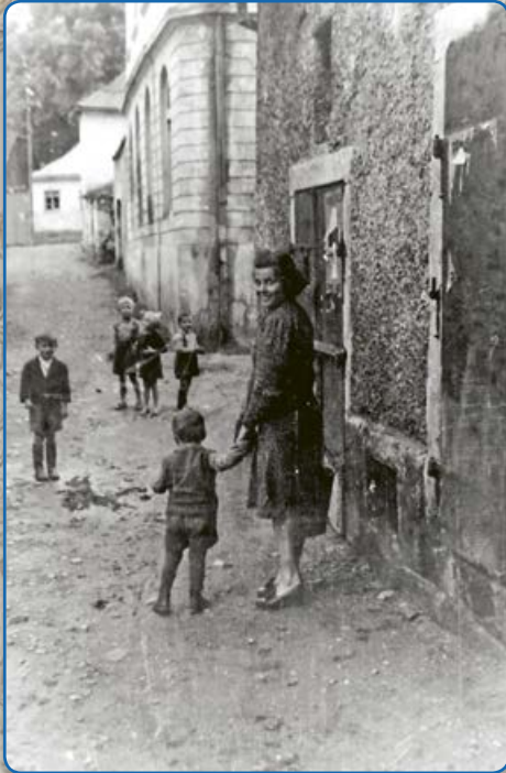
Život v židovské čtvrti