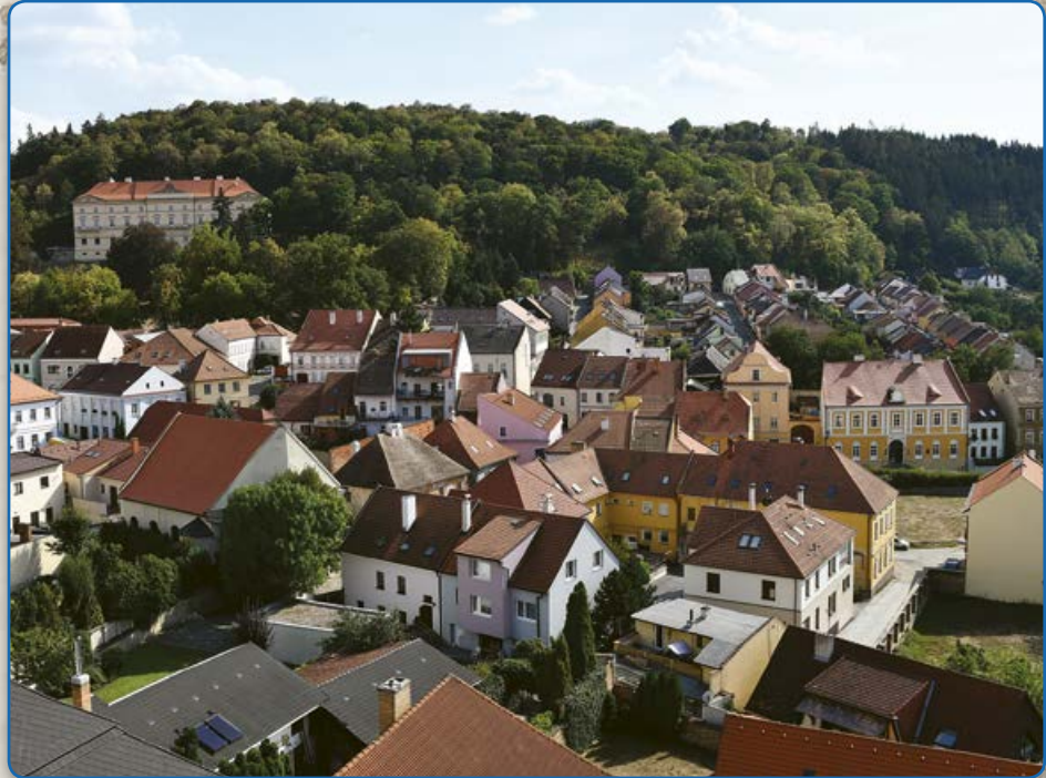
Pohled na část židovské čtvrti z věže kostela (2018)