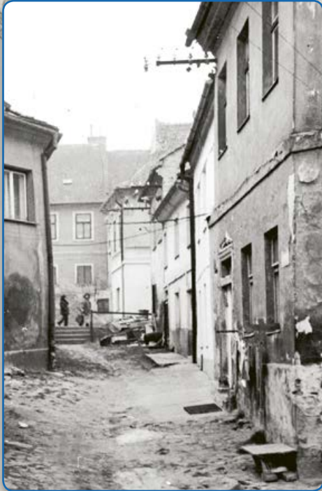
Ulice U Templu – pohled od synagogy maior (vpravo 1989)