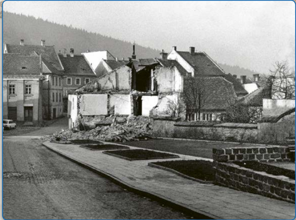
Ulice Zborovská – bourání původních domů (80. léta 20. stol.)