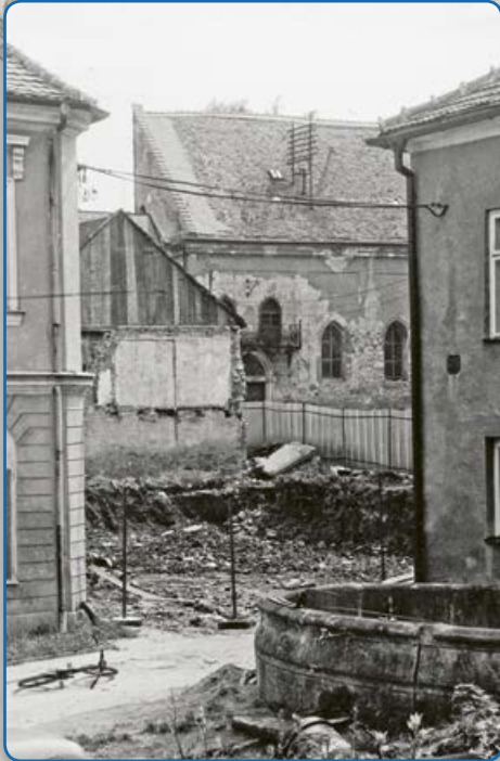
Kašna z roku 1875 v ulici U Koupadel (vpravo 1987)