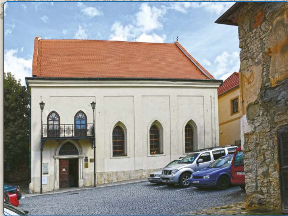
Synagoga maior (2019)