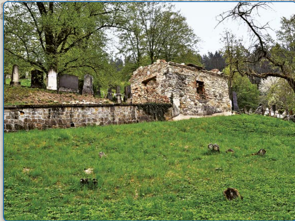
Márnice na židovském hřbitově před rekonstrukcí (2014)