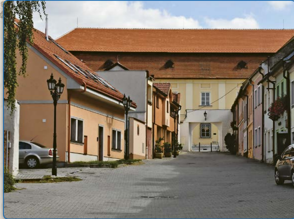
Plačková ulice (2019)