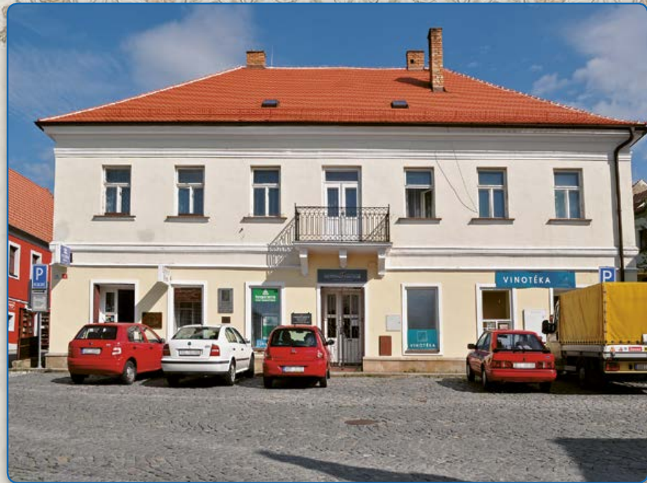
Ulice Zborovská (2014)