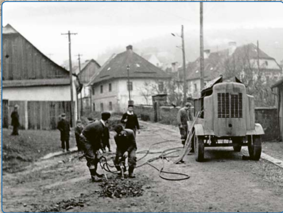
Ulice Ant. Trapla, kamenná zeď farské zahrady, hned za ní začínala židovská čtvrť