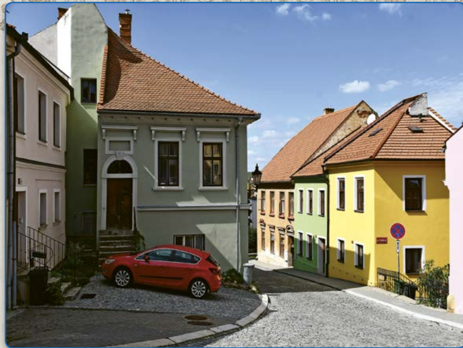
Opravené domy v ulicích U Vážné studny a Bílkova (2019)