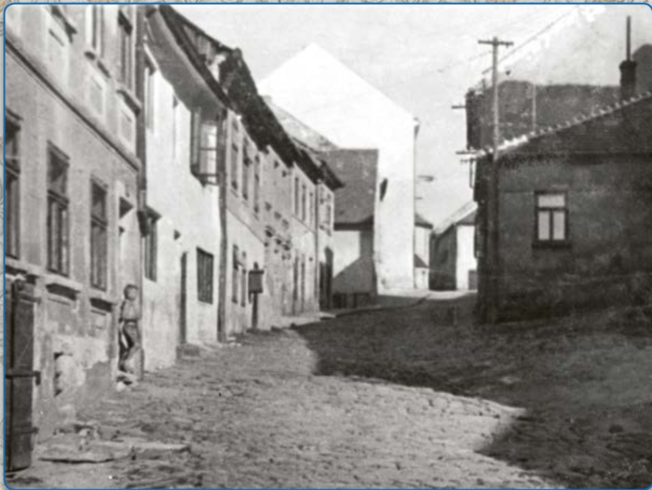
Bílkova ulice – domy, které stávaly naproti bývalému židovskému obecnímu domu