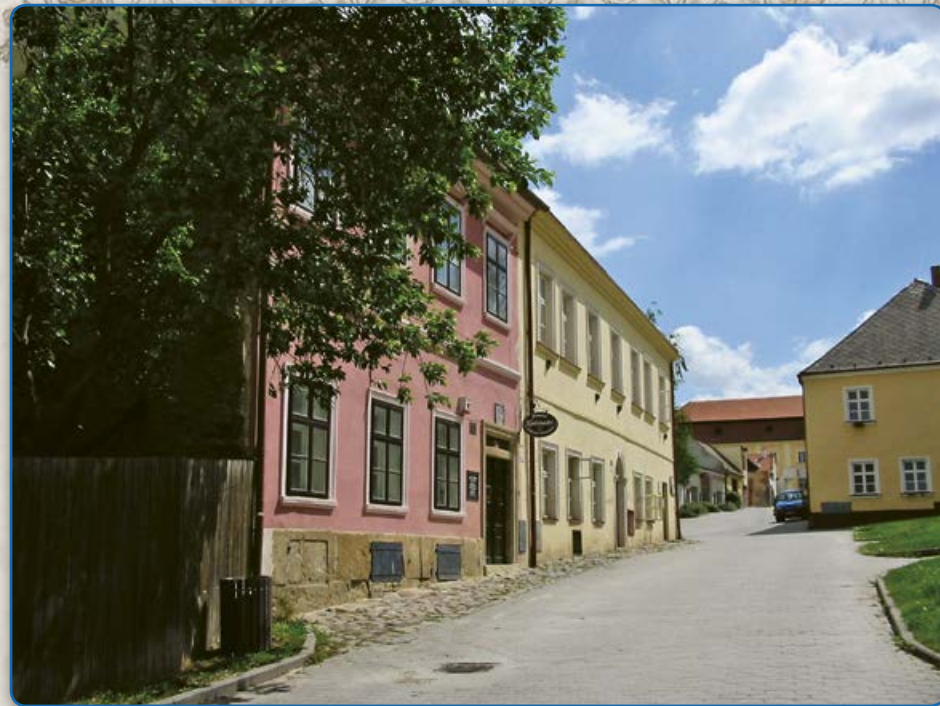
Pláckova ulice – v domě vlevo Minigalerie Zwicker (2009)