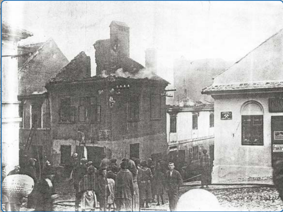
Požár domu stojícího na rohu ulic U Templu a Bílkova (1925)