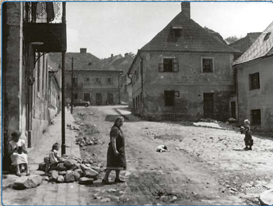
Ulice Ant. Trapla