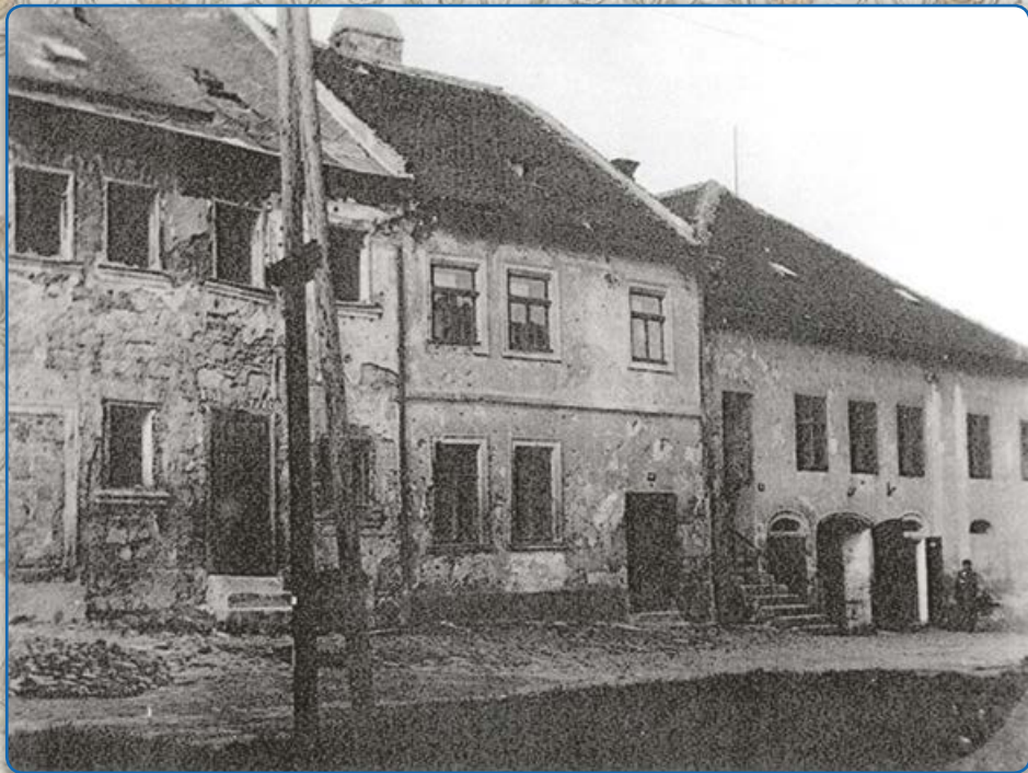
Plačková ulice – vpravo bývalé sídlo rabinátu a rabínův byt