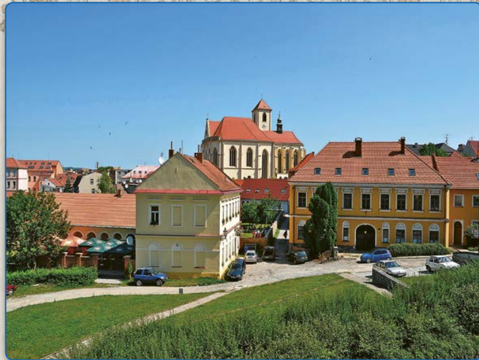
Ulice U Koupadel – vlevo bývalé židovské lázně, vpravo bývalá tovární budova (1975)