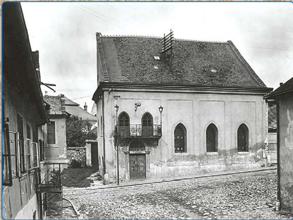
Synagoga maior (kolem roku 1950)