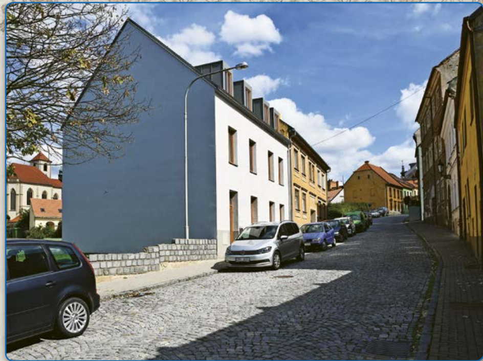
Bílkova ulice (2019)