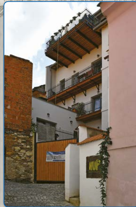
Proměna zákoutí v ulici U Templu (foto vpravo 2019)