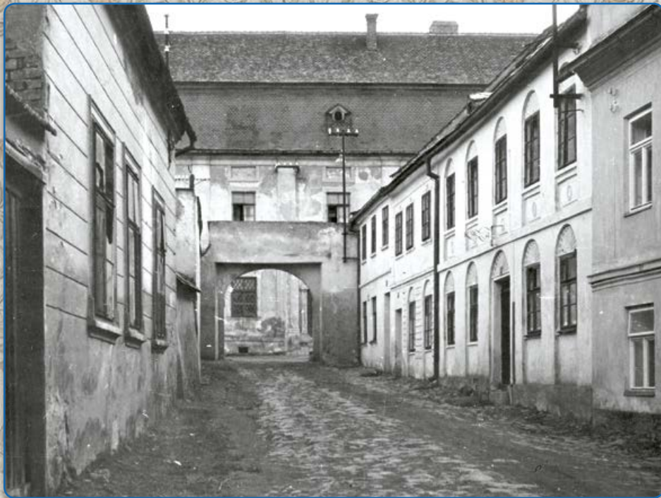
Plačkova ulice – brána do židovské čtvrti