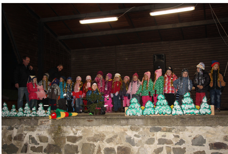
Rozsvěcování vánočního stromu