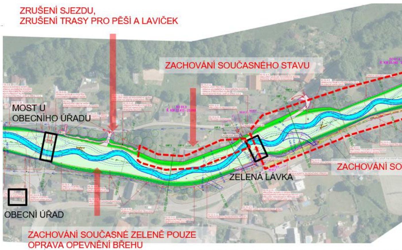
Schéma 1 změn v návaznosti vypořádání připomínek občanů

ZRUŠENÍ SJEZDU, ZRUŠENÍ TRASY PRO PĚŠÍ A LAVIČEK