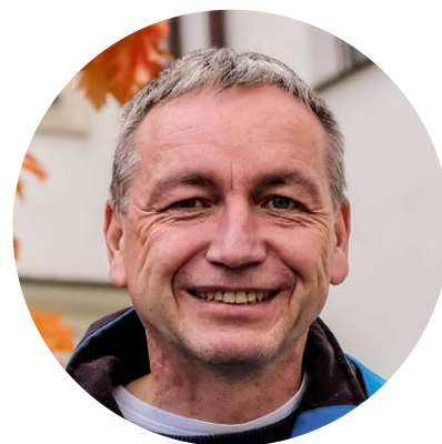
Pavel Pešek starosta

Přeji Vám co nejpříjemnější, byť studené, únorové dny.