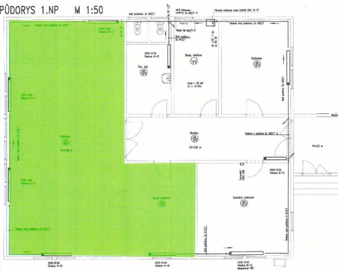
PŪDORYS 1.NP M 1:50