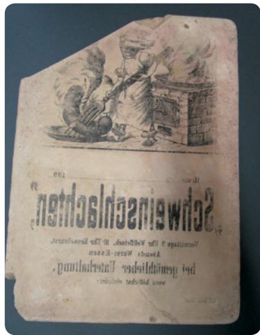
Litografický kámen nalezený na dvoře domu č.p. 165 s pozvánkou na "Veřejné vepřové hody" konané v Hostinném kolem roku 1890.

Nestává se zaměstnancům muzea v našem městě příliš často, že se jim do rukou dostávají předměty staré více než sto let a přímo vypovídající něco konkrétního o historii Hostinného. Je tedy téměř malým zázrakem, že v poslední době došlo k pozoruhodným objevům hned dvakrát za sebou.