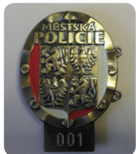
Služební odznak strážníka MP Hostinné

Upozorňujeme, že linka 156 není již pro území města Hostinné funkční.