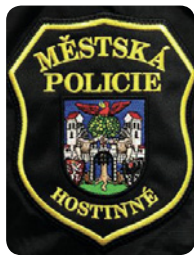
Rukávová výšivka strážníka MP Hostinné

Odznak je v dolní části doplněn služebním číslem.