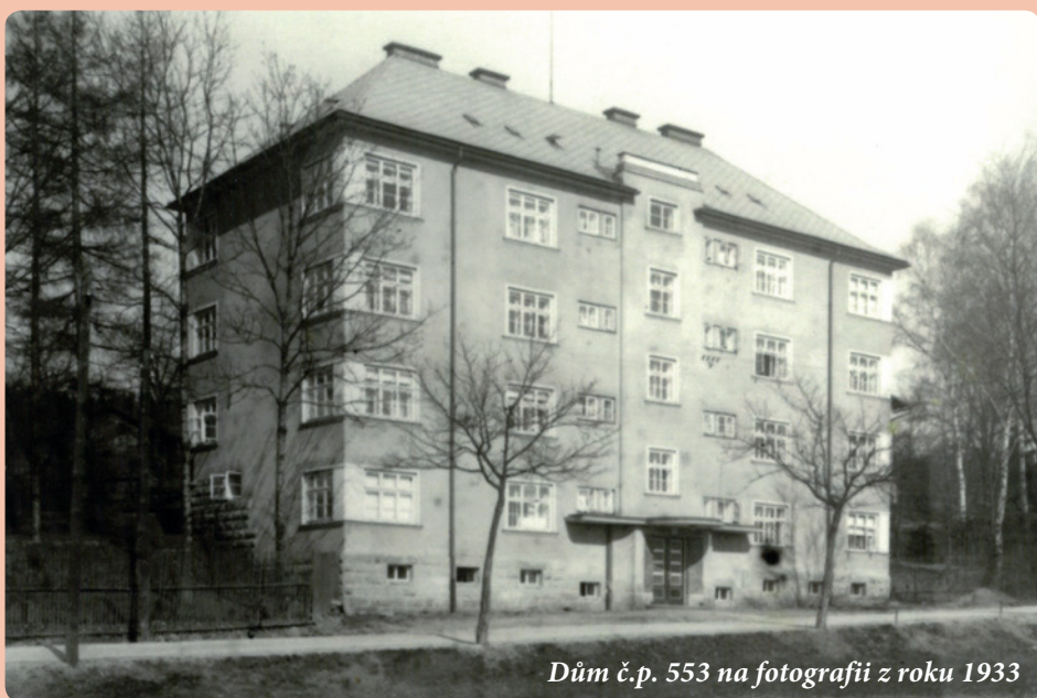
Dům č.p. 553 na fotografii z roku 1933

Byla to výjimka, protože výstavba obytných domů v té době ze strany města Hostinného již nebyla plánována. Poslední velkou stavbou, která město finančně zcela vyčerpala, byla výstavba městského kina v roce 1929. Budova obsahovala 14 bytových jednotek sestávajících z kuchyně a pokoje, dohromady o velikosti 40 metrů čtverečných. K tomu náležela předsíň, klozet a vestavěná spíž. Zřízení koupelen v předsíních bytů domu nebylo z důvodu nedostatku finančních prostředků v té době již možné. Vše bylo ale připraveno tak, aby bylo možno v příznivější době koupelny snadno dodělat. Ke každému bytu příslušely také dvě sklepní kóje a jedna půdní komora. Mimo to byly v domě k dispozici ještě dvě společné prádelny a dvě sušárny. Každý byt byl vybaven vlastním přívodem vody a odpadem. Měl zavedeno vlastní osvětlení, vytápění a uzávěr plynu. Z pohledu stavebního bylo uvedeno, že dům je vystavěn jednoduše, ale velmi kvalitně.