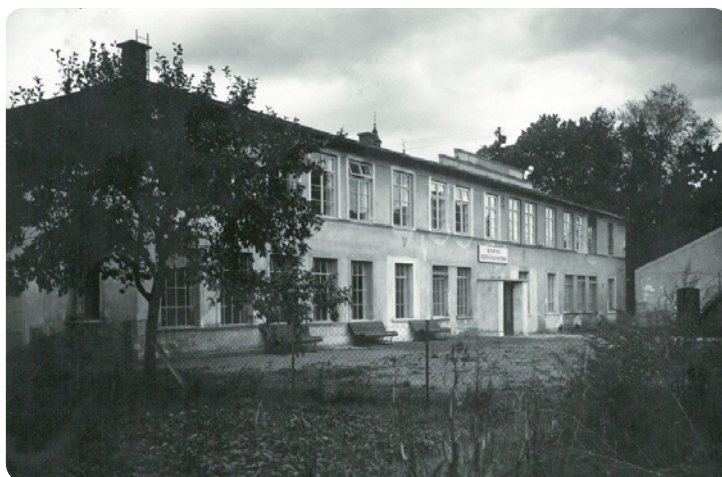
Budova Státní odborné školy papírenské v Hostinném (naproti bývalé červené škole), foto František Erlebach 1948