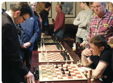
Simultánka s Navarou