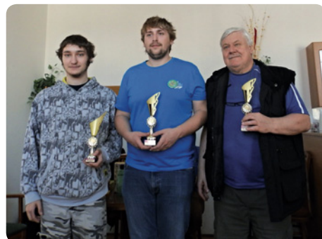
Tři nejlepší hráči ŠK Hostinné