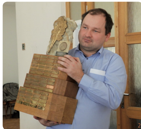
Vítěz 60. ročníku