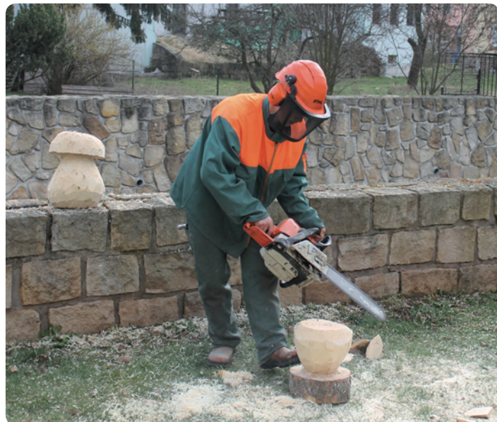
Fotografie z doprovodné akce, foto Zbyněk Rek

Dalším cílem akce je i provázání činností jednotlivých oborů. Žáci oborů kuchařské práce a provozních služeb podporují průběh soutěže občerstvením a pro další technické obory je určitě zajímavá předváděcí výstava ručního nářadí.