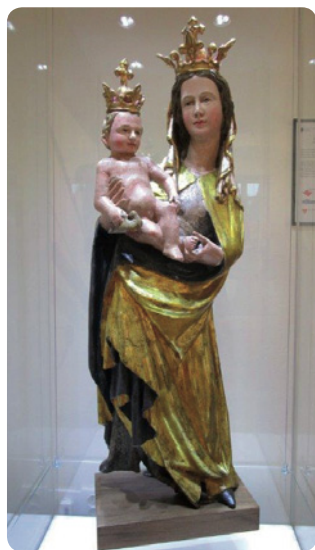
Plastika Madony s dítětem z doby kolem roku 1400 v expozici městského muzea