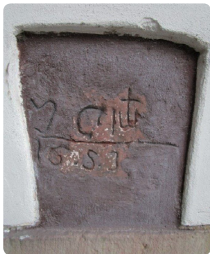
Mistrovská značka z roku 1653 na domě č. p. 68 v Hostinném

V pravém oblouku podloubí (při čelním pohledu) měšťanského domu č. p. 68 v Hostinném se ve výšce 125 cm nad zemí nachází do omítky vyrytý malý obdélníček o velikosti 29 × 23 cm. Ten obnažuje část kvádry zhotoveného z místního červeného pískovce. V jeho poli se zachovala tzv. mistrovská kamenická značka. Tato značka je němým svědkem