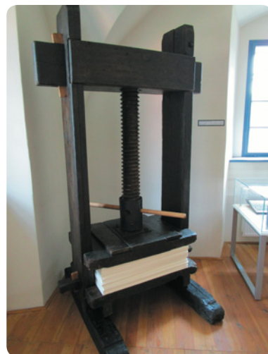
Papírenský lis, poč. 18. století