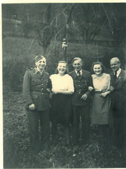
Belgičtí zajatci v Hostinném, večer dne 9. května 1945

Svobody jsme se dočkali 9. května 1945 ráno. Probudily nás zvuky motorek a tlumené údery na dveře. Všichni jsme se rychle nahrnuli k oknům. Viděli jsme muže, jak do přívěsů svých motorek nakládají kulomety. Byli to čeští partyzáni. Podle rudých pásek na rukávech jsme se později dozvěděli, že to byli příslušníci „Revoluční gardy“. Nejprve vyrazili uzamčené dveře na velitelství tábora, ale všechny německé strážce z lágru byly už pryč. Nikdo z nás nevěděl, kdy a kam se poděly. Potom byly otevřeny dveře u baráků zajatců a předána informace, že jednotky sovětského