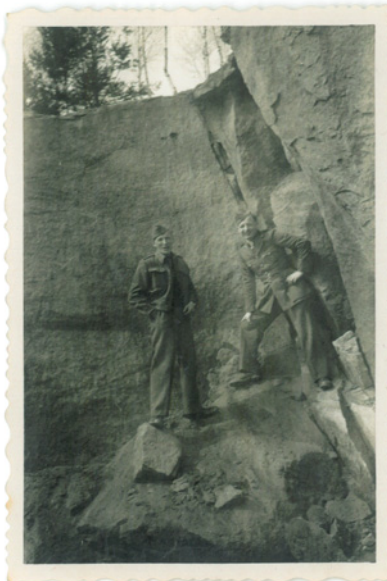
Belgičtí zajatci nasazení na práci v lomu nad Arnultovicemi, 1944