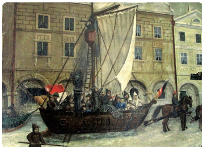
Loď AUSTRIA v roce 1875