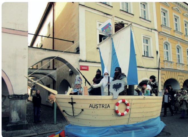
Loď AUSTRIA v roce 2015