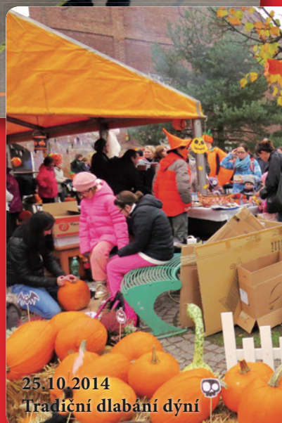
25.10.2014 Tradiční dlabání dýní