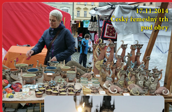
17.11.2014 Český řemeslný trh pod obry