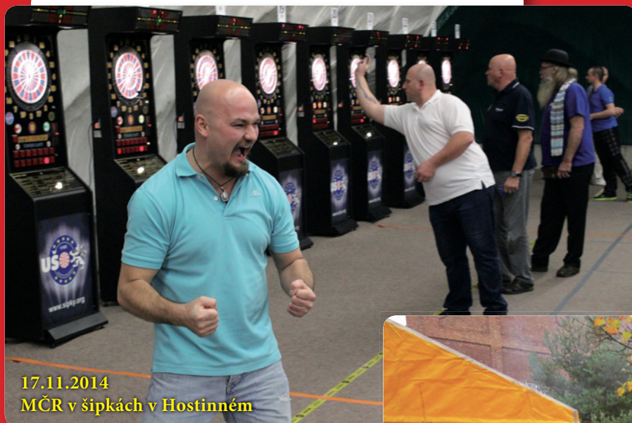
17.11.2014 MČR v šipkách v Hostinném