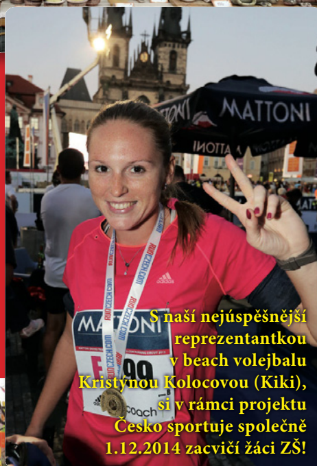
S naší nejúspěšnější reprezentantkou v beach volejbalu Kristýnou Kolocovou (Kiki), si v rámci projektu Česko sportuje společně 1.12.2014 zacvičí žáci ZŠ!