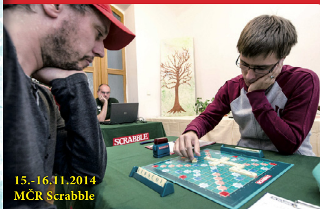
15.-16.11.2014 MČR Scrabble