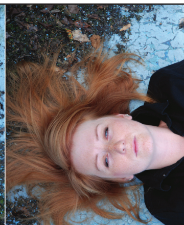
Iveta Dvořáková malba