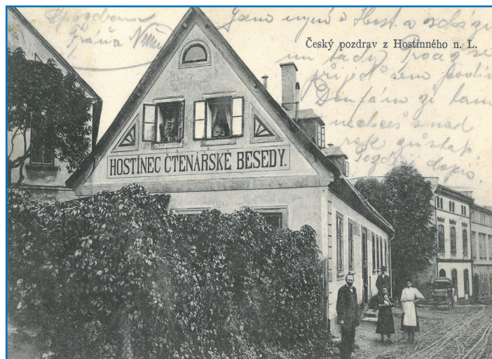
Hostinec „Čtenářská beseda“, na pohlednici z roku 1901