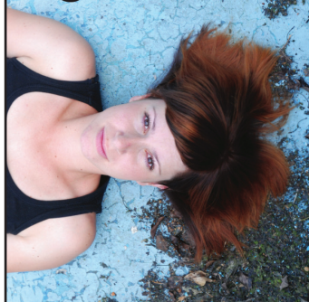
Markéta Lhotová kresba/grafika