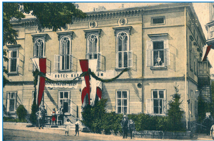
Slavnostní otevření Národního domu 5. června 1921

Kromě jiných spolků byla v Hostinném založena Osvětová komise starající se o duševní život české menšiny a Česká okresní péče o mládež, která se Zdravou generací, Místním školním výborem a Rodičovským sdružením pečovala o české děti. Z politických stran byly činné strana Československá národně socialistická (poč. 30. let), Československá sociálně demokratická strana dělnická (1925), strana Národního sjednocení (1935) a Republikánská strana zemědělského a malorolnického lidu (1937). Z obecně prospěšných spolků bylo v roce 1922 založeno stavební družstvo „Krkonoš“ se 40 podíly po 100,- Kč, které z pozemkové reformy zakoupilo přibližně 6 ha pozemků na výstavbu rodinných domků pro příslušníky české menšiny. Z českých živnostenských podniků byly v provozu firmy na výrobu papírového zboží Štěpán Vinš a Jan Bárta, prodejna uzenářského zboží a pobočka firmy „Baťa“. Z peněžních ústavů byla v Národním domě zřízena sběrna Občanské záložny v Jilemnici.