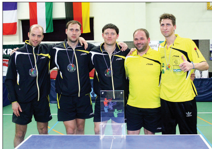
Stolní tenisté SV Post Mühlhausen s pohárem za vítězství v TT-Intercupu

Nakonec rozhovor mediálního pracovníka České asociace stolního