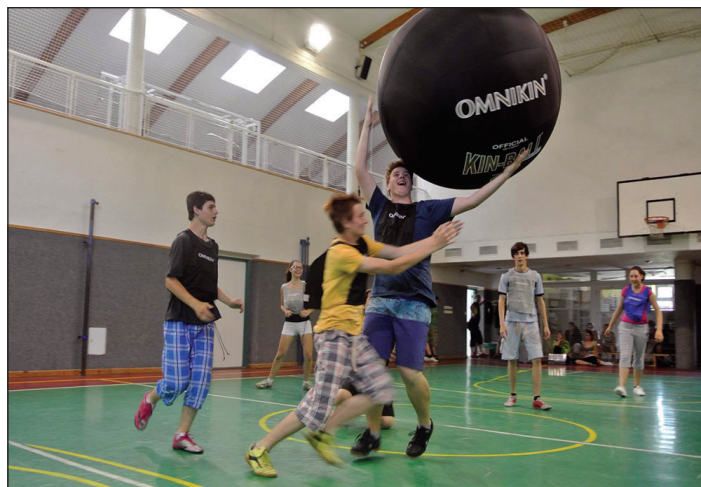
fotografie z hodiny s KIN-BALLEM