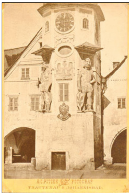
Radniční věž na fotografii A. C. Pitzeila z roku 1868

dvou rytířů ve zbroji-obrů , vysokých 4,80 m , jako symbolů starého tržního práva města. V roce 1653 radnici obývali radní sluha s rodinou, obecní posel, zvoník a tři staří podruzi. V roce 1789 byly na věž nainstalovány hodiny s třemi ciferníky. Roku 1849 se Hostinné stalo sídlem soudního okresu . Soud společně s berním úřadem našel své sídlo v budově radnice. Zřízeno bylo vězení pro dlužníky, politické delikventy a byt pro dozorce. Dnešní podoba radnice pochází z přestavby roku 1874. Poslední oprava radnice proběhla v roce 1912. Bylo obnoveno sgrafito a nainstalován plastický kamenný městský znak s obry. Od počátku 20. století sloužila radnice pro potřeby starostenského úřadu, městské spořitelny a později i městského muzea .