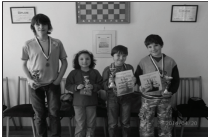
Vítězové žákovského turnaje