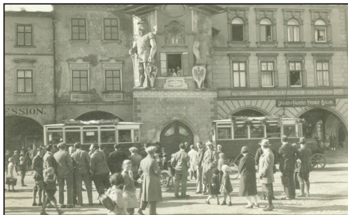
Zahájení autobusové dopravy na trase Hostinné - Černý Důl, 1929

Nejstarší a nejlepší silnicí v okrese byla tzv. „pražská silnice“ spojující Vratislav s Prahou. Vedla přes Trutnov, Nové Zámky a Jičín. Byla postavena v letech 1816-1820. Na ni byla od roku 1834 napojena i nově postavená silnice z Hostinného o délce 3,7 km. Roku 1836 byla postavena nová tzv. „říšská silnice“, která měla vést z Trutnova přes Hostinné do Jičína. Městská rada však trasu silnice městem odmítla. Důvodem byly obavy z průchodu vojsk městem. Byla tak zachována stará trasa přes Nové Zámky. Šíře nové silnice umožňovala průjezd dvou děl vedle sebe. Brzy nato byly vybudovány i silnice lánovská a rudnická. V letech 1892-93 byla postavena silnice do Čermné. V roce 1907 se započalo s dlážděním dnešních ulic Dolní brána, obě fortny a Hradební ulice čedičovými kostkami. Bylo po nich však zakázáno jezdit automobily. Později pod tlakem rozvoje motorismu byl zákaz zrušen, ale v roce 1921 byla omezena rychlost jízdy ve městě u osobních automobilů na 15 km/h a nákladních automobilů na 6 km/h. Projíždět se mohlo pouze ulicemi Nádražní, Školní, Hrnčířskou a Horskou. V letech 1927-1928 byly vydlážděny ulice vedoucí do náměstí. Roku 1929 byla zahájena autobusová doprava na lince Hostinné-Černý Důl přes Rudník a Hostinné-Slemeno s napojením na Jičín. Zastávka autobusů byla u radniční věže. V roce 1933 byly ve městě nainstalovány dopravní značky.