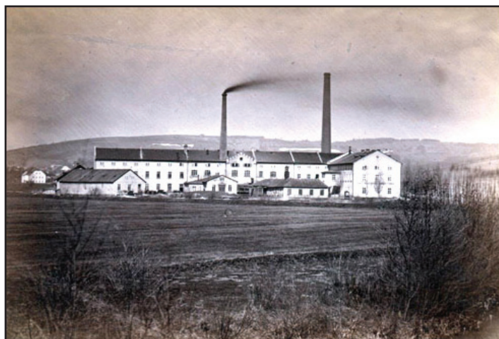
Papírna firmy Eichmann v Hostinném na fotografii z roku 1868.