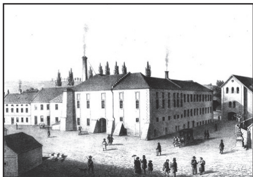
Papírna Labský mlýn na litografii z roku 1840.

1856 byla továrna, v té době zaměstnávající již 600 osob, těžce postižena požárem. Ten v krátkém čase celý podnik obrátil v sutiny a popel. Škoda byla vyčíslena na 100 000 zlatých. Požárem bylo