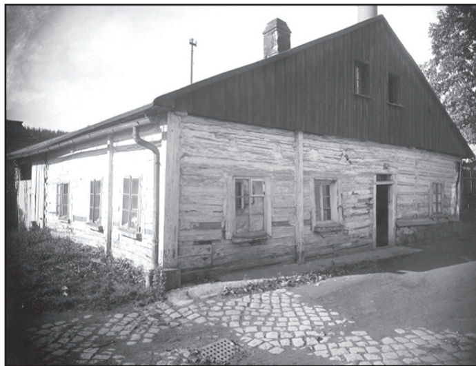
Dům č. p. 88 v Labské fortně, kde 9. září roku 1778 přenocoval císař Josef II. Foto z roku 1947. Dnes zbourán.