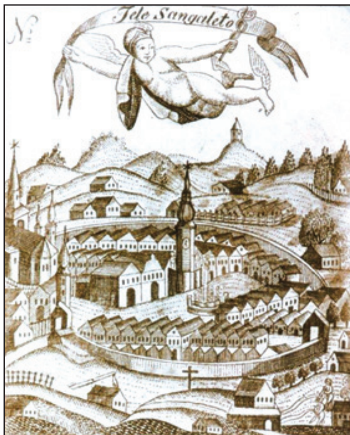
Nálepka na balíky s plátnem vyvážené v 18. století z Hostinného – tzv. „Santgaletky“