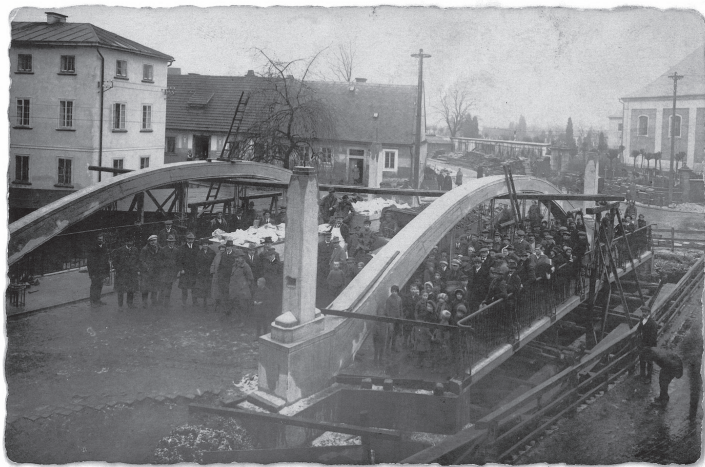
Zatěžkávací zkouška nového mostu 29. listopadu 1923

V roce 1881 byl starý zchátralý dřevěný most odstraněn a na jeho místo nainstalován nový, tentokrát již železný. Tento most sloužil obyvatelům města plných 42 let. Na jaře roku 1923 proběhla regulace břehů toku Čisté a při této příležitosti bylo rozhodnuto odstranit starý, již prorezivělý železný most a nahradit ho novým mostem betonovým. Železný most byl odstraněn v měsíci červnu a zároveň s ním přestěhována do zahrady vedle stojícího domu i socha sv. Jana Nepomuckého z 18. století, která stála hned vedle mostu na klášterní straně. Za přestěhování sochy obdržela stavební firma Ignáze Janetschka z Hostinného 1.610,- Kč. Výstavbou nového betonového mostu byla pověřena firma Rellea Neffe z Ústí nad Labem. Z počátku stavba pokračovala velmi pomalu. Doprava byla vedena přes dřevěný provizorní most postavený hned vedle staveniště směrem ke klášteru voršilek (dnes odborné učiliště). Tento nouzový most postavila místní stavební firma Ing. Otto Fiedlera za 17.000,- Kč. K betonování vlastního nového mostu došlo až ve dnech 16. - 20. října 1923.