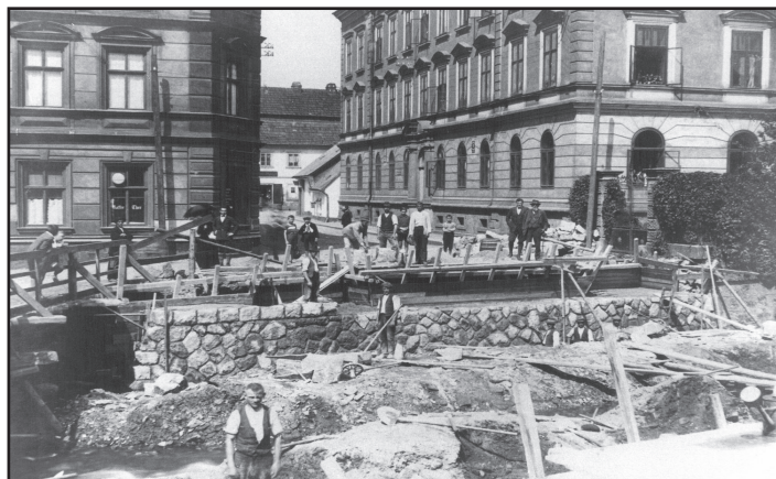
Z počátků výstavby nového mostu přes Čistou - srpen 1923

V majetku města Hostinného se od pradávna nacházelo několik mostů, které byly původně postaveny ze dřeva. S jejich vlastnictvím pak souvisela i celá řada práv, ale také povinností. Nejdůležitější povinností města bylo se o mosty starat a udržovat je v provozuschopném stavu. Ale také právo vybírat mýtné, mostné či clo za průjezd každého vozu a převoz každého zboží. Z vybraných peněz pak vrchnost prováděla opravy mostů, které byly často těžce poničeny při prudkém jarním tání sněhu na horách nebo při nenadálých letních povodních po průtržích mračen. Právo vybírat mostné město Hostinné získalo již od svého majitele Jiřího z Valdštejna (1525-1584). Toto právo dokládá i listina psaná na pergameni a uložená ve Státním okresním archivu v Trutnově. Byla sepsána dne 31. října 1653 a císař Ferdinand III. v ní svým podpisem obnovuje privilegium města na vybírání cla na mostě přes Labe. Její originál byl nedávno vystaven v městském muzeu u příležitosti prezentace nejstarších dochovaných listin pocházejících z archivu města. Za průjezd mostem byly od poplatku osvobozeny pouze domácí vrchnostenské povozy. V případě Hostinného se jednalo zvláště o mosty přes řeku Labe, a to o most pod Kudrnáčem a o most na Dobré Mysli. Brzy k nim však přibyl i most přes říčku Čistou (mylně označovanou také jako Mydlici z německého Seifenbach).