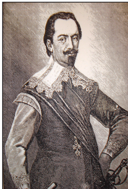
Albrecht z Valdštejna, majitel města Hostinného v letech 1622 - 1634