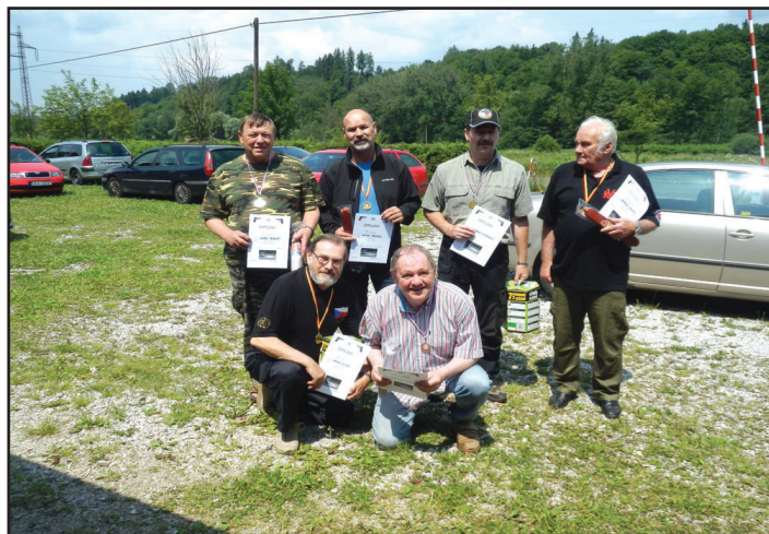
skupinové foto vítězů s diplomy a medailemi

Střelnice se nachází nalevo od silnice mezi Hostinným a Kunčicemi (směr Vrchlabí) na rovině asi 200 m za železničním přejezdem (na výpadovce z Hostinného jeďte vlevo).