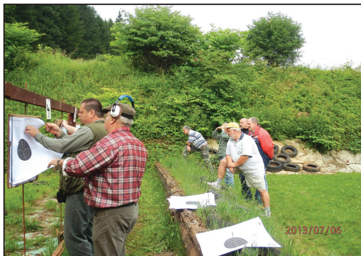
rozhodčí vyhodnocují zásahy a závodníci bedlivě kontrolují jejich práci