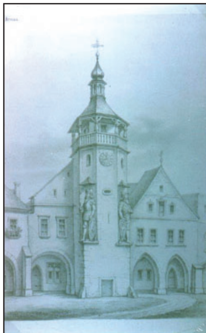
Radnice v Hostinném kolem roku 1700