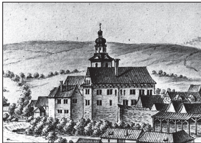
Zámek v Hostinném roku 1804

Zároveň s městem byl budován i městský hrad , který byl i jeho nejpevnější součástí. První zmínka o hradu pochází z roku 1316 . Svoji významnou roli jistě sehrál v roce 1424 při neúspěšném dobývání města vojsky Jana Žižky z Trocnova. Znovu je hrad zmi-