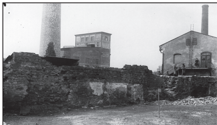
Bourání městských hradeb v Labské fortně

V prvních desetiletích 20. století v Hostinném působili ještě další dva fotografové. Prvním z nich byl Ignaz Fietz , který s podnikáním ve fotografii započal v roce 1905. Několik let mu trvalo, než se vypracoval a kvalitou svých fotografií dosáhl na úroveň konkurence. Druhým a daleko oblíbenějším byl fotograf Adolf Göldner . Atelier sídlil na náměstí v domě č. p. 19. Göldner se věnoval jak fotografování portrétů, tak i fotografování života a proměn města.