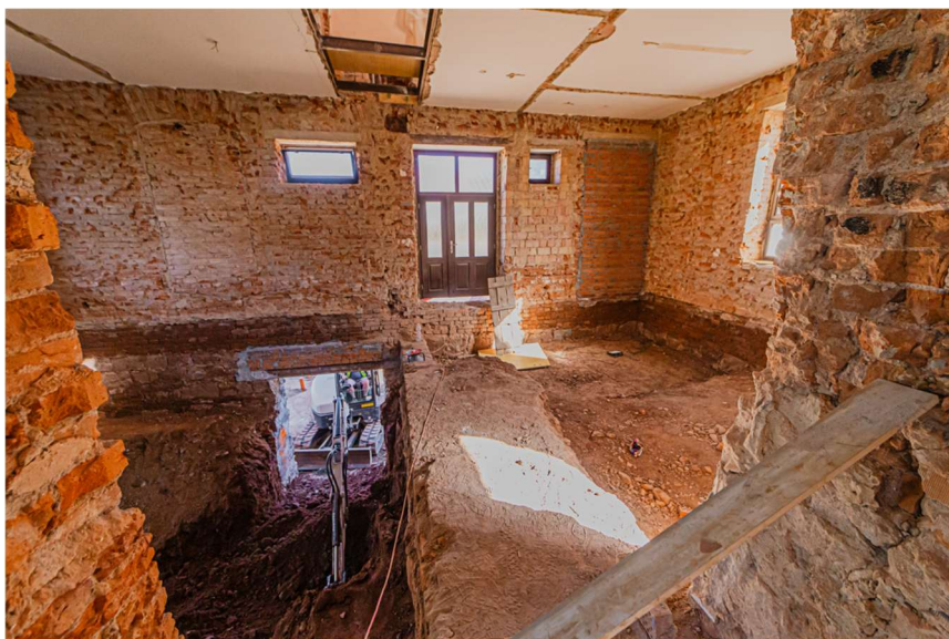
Zazdívání původních otvorů