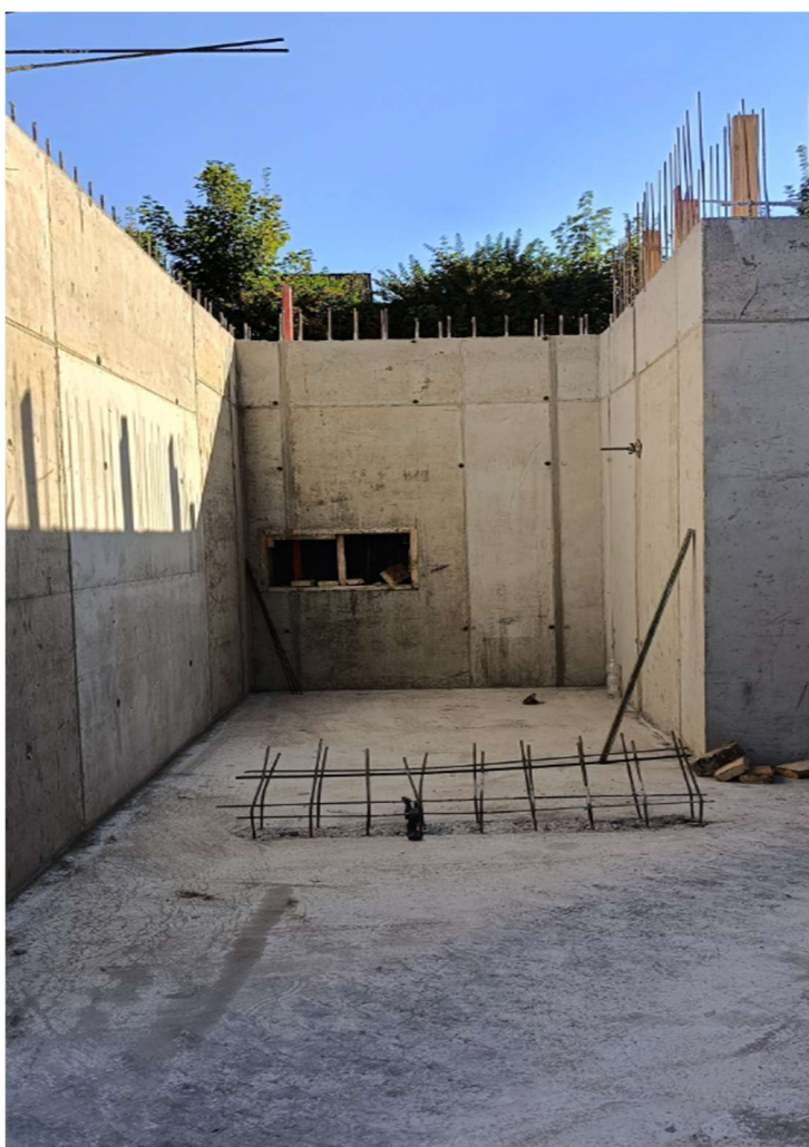
Přístavba nového křídla foto č.2