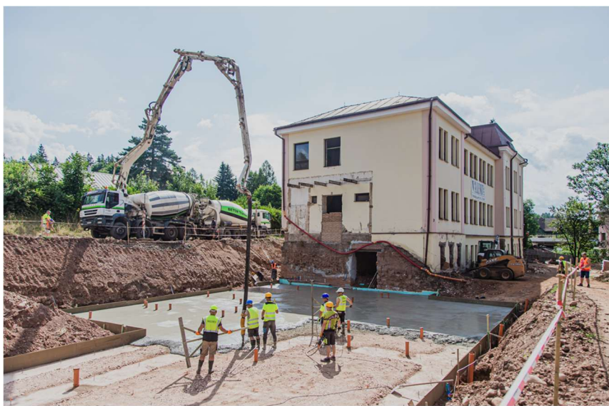
Základy pro přístavbu nového křídla

Stavební práce Domova pro seniory pokračují dle harmonogramu, základy nové přístavby jsou hotové a nyní už se specifikuje konečná podoba výtahu.