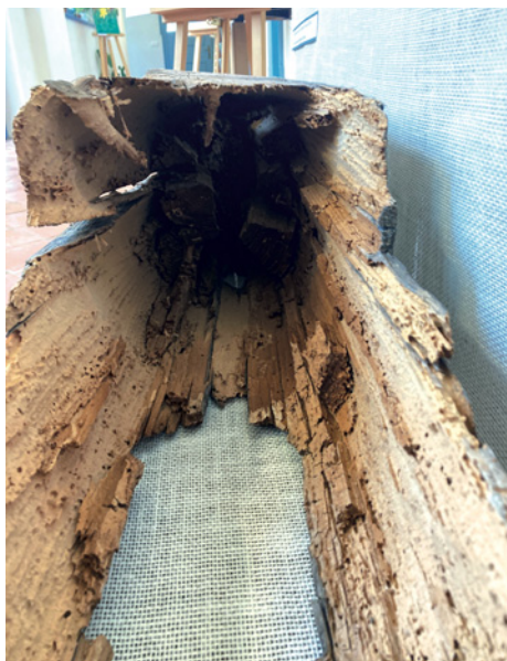
Hnilobou a dřevokazným hmyzem poškozený trám krovu kostela

Děkanský kostel v Hostinném patří mezi významné dominanty našeho města a je nedílnou součástí městské památkové zóny. Chceme-li návštěvníkům města prezentovat jeho nenahraditelnou hodnotu a využívat prostor této jedinečné památky ke kulturním účelům, je nutné věnovat naší pozornost i jeho technickému stavu. Je pro mě potěšením napsat, že zastupitelé Hostinného tak v posledních letech činí a k záchraně kostela přijímají potřebná usnesení. Na počátku roku 2019 se ve velmi neutěšeném stavu nacházela střecha kostela. Proto bylo rozhodnuto zahájit přípravy na celko-