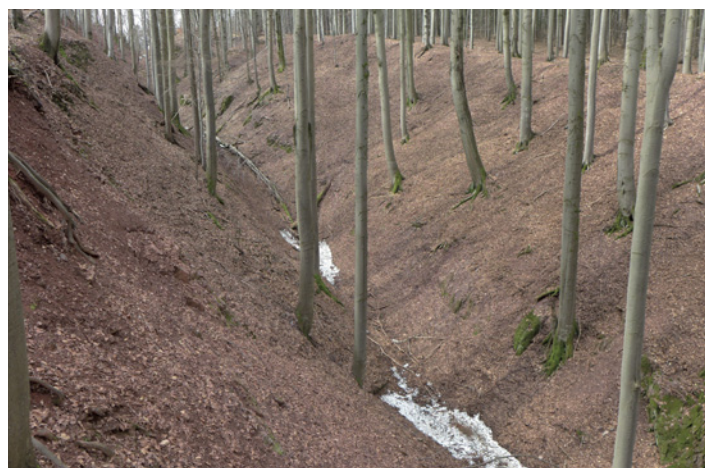
Jiřský příkop je i dnes velmi výraznou reliéfovou formou v okolní krajině.

Historie těžby zdejšího zlata je tak trochu velká neznámá. Dochované písemné zdroje jsou totiž velmi kusé a mimo jiné neobjasňují ohromný rozdíl mezi kuba-