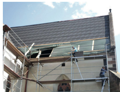
Oprava jihozápadní části střechy kostela, 2024

Práce realizované na opravě střechy kostela jsou financovány hned z několika zdrojů. Nejdůležitějším jsou dotační prostředky z Programu regenerace městských památkových zón Ministerstva kultury České republiky za spoluúčasti vlastníka objektu a města Hostinné v poměru: Ministerstvo kultury - 50%, vlastník - 40% a město Hostinné - 10% z celkových nákladů prací. Na úhradě nákladů spojených s opravami se rovněž finančně podílel i Královéhradecký kraj a Česko - německý fond budoucnosti.