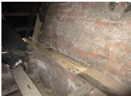
Výměna poškozených částí trámů krovu kostela tzv. plátováním, 2024

vou rekonstrukci střešního pláště. Na základě doporučení Komise pro regeneraci města Hostinného a ve spolupráci s pracovníky Státní památkové péče v Josefově bylo připraveno závazné stanovisko a vydáno rozhodnutí potřebné k zahájení oprav. Vzhledem ke složitosti prací a finanční náročnosti byly plánované práce rozděleny do několika etap. S rekonstrukcí střechy kostela bylo započato I. etapou v roce 2020 na severovýchodní části a práce pokračovaly II. etapou v roce 2021 opravou jihovýchodní části střechy kostela. Po jednorozhodnutí pauze se práce daly znovu do pohybu III. etapou v roce 2023 opravou severozápadní části a v roce 2024 pak pokračovaly IV. etapou opravy jihozápadní části střechy. K úplnému dokončení oprav střechy kostela zbývá realizovat ještě poslední V. etapu, která je naplánována na rok 2025.