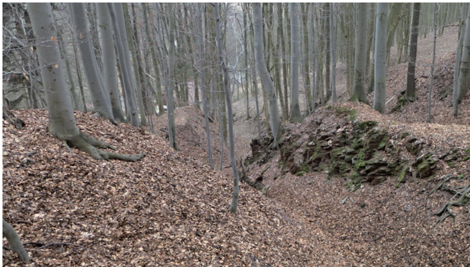
Také Bolkovský příkop v horní části Bolkova dosahuje velkých rozměrů.

mi. V Javorníku byl již vody dostatek a to umožnilo, že se zde rýžovalo „ve velkém“, dokonalejší metodou pomocí žlabů, které se vystýlaly ovčími kůžemi nebo jedlovými větvičkami, v nichž se těžší zlatinky zachycovaly. To mělo za následek, že zde z prorýžovaného materiálu vznikaly nikoliv obvyklé kruhovitě kopečkovité sejpy, ale dlouhé, v podobě valů. Nelze dokonce