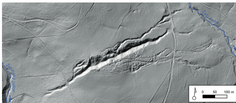
Letecký snímek (tzv. lidarový) Jiřského příkopu.

Ale i některé doly v povodí Čisté (přesněji řečeno jejího přítoku Lučního potoka od Javorníku) již se „spádem“ k Hostinnému jsou impozantních rozměrů. Na prvním místě je to tzv. Jiřský příkop, povrchová dobývka poblíž horního konce Javorníku. Nad jeho rozměry stojíte v němém úžasu: dosahuje délky 700 m, šířky až 30 m a hloubky do 20 m, nemluvě o přilehlých menších tvarech (pinky, obvaly, těžní rýhy). Kubatura vytěženého materiálu jen z hlavní dobývky je 96 500 m 3 , a když uvažíme, že to bylo vyhloubeno jen pomocí nástrojů odpovídajícím dnešním krumpáčům, lopatám a jakýmsi „trakařům“, je to až neuvěřitelné. Lokality však trpěla nedostatkem vody, pro rýžování nezbytné. Proto se odtud vozil materiál v podobě již jakéhosi koncentráta k vodní tvrzi v Javorníku. O frekvenci této dopravy svědčí dodnes zachovalý celý systém úvozů mezi oběma lokalitami