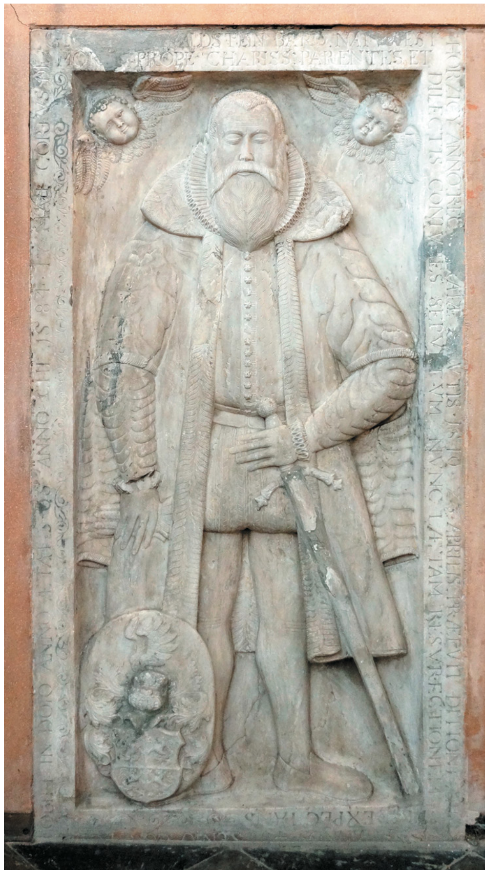
Náhrobník Jiřího z Valdštejna z roku 1584 umístěný v děkanském kostele

Jiří z Valdštejna byl rovněž velmi činný ve vysokých zemských a královských úřadech. V letech 1553 a 1558 je uváděn jako přísedící z panského stavu u soudní komory a v letech 1569, 1571, 1575 a 1580 se účastnil jednání pražského zemského sněmu. Rovněž je v letech 1558, 1561, 1567, 1571, 1574, 1577 a 1580 zmiňován jako relátor (zpravodaj, zapisovatel) u českých zemských desek. V roce 1541 sepsal společně s Matyášem z Lužnice v českém jazyce zprávu o bitvě u Ofen (německy Buda, část města Budapešť ležící na pravém břehu řeky Dunaje), kde došlo k porážce rakouského vojska Turky a nechal ji vytisknout. V neposlední řadě zastával Jiří z Valdštejna úřad hejtmána Královéhradeckého kraje v letech 1554 a 1583. V roce 1575 se Jiří z Valdštejna účastnil velkého a důležitého sněmu, kde se projevil jako úporný obhájce Českých bratří. Svědectví v zápisu pořízeném na tomto sněmu o jeho vystoupení nám říká následující: „Onehda pan Jiří z Valdštejna, když Kapoun jakýsi nemálo lecčehož žvanil na potupu Bratřím, výborně dal Bohu a pravdě své svědectví“. Dochované zápisy o Jiřím z Valdštejna hovoří jako o „povždy vlasti a národa svého horlivě věrném synu“. Když byl v Praze dne 20. srpna roku 1565 vystrojen slavnostní