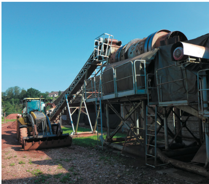
Celkový pohled na úpravářskou linku s rotační bubnovou pračkou. Zařízení je z velké části zakryté protihlukovými plachtami.

Granáty se sice vyskytují na řadě míst po celém světě, ale právě český granát je z nich brán pro své syté červené zbarvení za nejkrásnější a šperkařsky nejcennější. Je považován za mineralogický symbol Čech, s čímž koresponduje i jeho název. S tím souvisí i to, že v 19. století se stal atributem národního obrození. Při