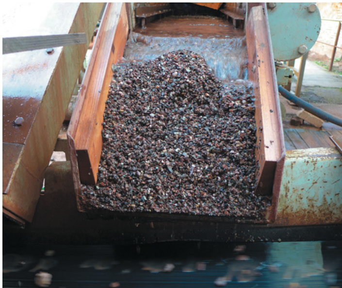
Pohled do gravitační sazečky s výsledným „koncentrátém“. V popředí (dole) se hromadí odcházející lehké minerály, zatímco těžké, včetně českých granátů, se nalézají nahoře.

Vedle samotných granátů se zde ve vytěženém koncentrátu nalézá okolo 30 minerálů, z nichž některé patří ke známým drahým kamenům jako safír, topaz, zirkon nebo ametyst. Jejich množství i velikost jsou však až na vzácné výjimky nepatrné (obvykle s průměrem okolo 1 mm), takže o jejich praktickém šperkařském využití se nedá uvažovat. K tomu přistupuje navíc ještě zlato, ryzí platina, ruthenium a iridiosmium, což je unikát v rámci celé republiky, a také chalcedony a drobné úlomky araukaritů. Zdejší těžba pyropů je však spojena ještě s jednou, byť velmi problematickou zajímavostí. V rámci těžby ve Vestřeví byly totiž nalezeny i dva diamanty nažloutlé barvy. Jeden má rozměry 5,3 × 5,2 × 3,4 mm a váží 0,19 g, druhý má rozměry 7,0 × 5,2 × 4,3 mm a hmotnost 0,32 g. Jsou tedy také velmi malé, ale přesto o dost větší než oba z Českého středohoří. Jenže to má háček. Na začátku byl spor již o to, zda to vůbec jsou skutečně diamanty, anebo jiný drahokam, zirkon. Ten je sice označován jako sourozenec diamantu,