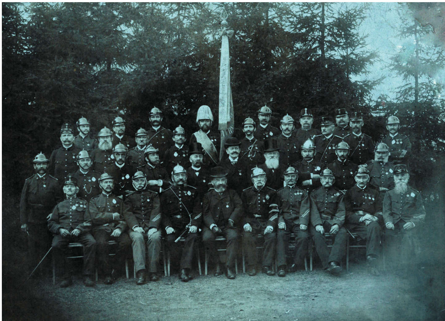
Spolek dobrovolných hasičů Hostinné. Fotografie čestných a zasloužilých členů, kolem roku 1900.

spolku. V roce 1866, kdy naším krajem prošla prusko-rakouská válka, spolková činnost téměř ustala. Válečné hrůzy tohoto roku a pruská invaze do města poznamenaly životy mnoha jeho obyvatel. Hasiči se museli podrobit nařízení válečného komisaře a spojit se se spolkem válečných veteránů. Společně prováděli hlídkování na mostech přes Labe na Dobré Mysli a Nových Zámcích, které byly připraveny k destrukci pomocí smolných sudů v případě útoku pruského vojska. Tato císařskou armádou