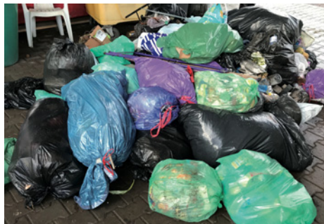
Foto č. 1 – směsný komunální odpad svezenny dne 4. 1. 2024 od popelnic ve městě

V popelnicích se nacházelo velké množství nevytríděného odpadu.