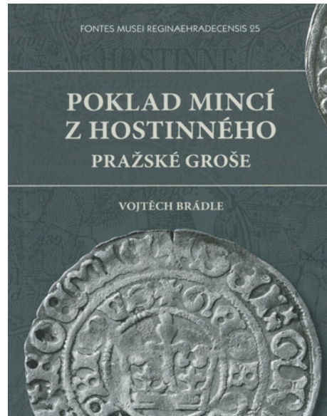
Titulní strana publikace

svého archivu poskytlo řadu důležitých informací, archivních dokumentů a historických fotografií dokládajících mincovní nález a jeho další osudy. Vydání knihy svým rozhodnutím finančně podpořila i Rada města Hostinné, za což ji patří upřímné díky.