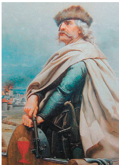
Jan Žižka z Trocnova, dobyvatel Hostinného v roce 1424

hodnuto od dalšího dobývání ustoupit. Lze předpokládat, že obléhatelé byli také vyčerpáni předcházejícími boji a dlouhými pochody. Dobytí Hostinného pro ně nebylo zas až tak důležité. Dobývání měst opevněných vysokými kamennými hradbami a širokými vodními příkopy, ke kterým Hostinné patřilo, nebylo nikdy jednoduchou záležitostí ani pro husity. Na Žižkovo tažení jistě doplatilo i nejbližší okolí města, protože husitské vojsko muselo být průběžně zajišťováno zásobováním.