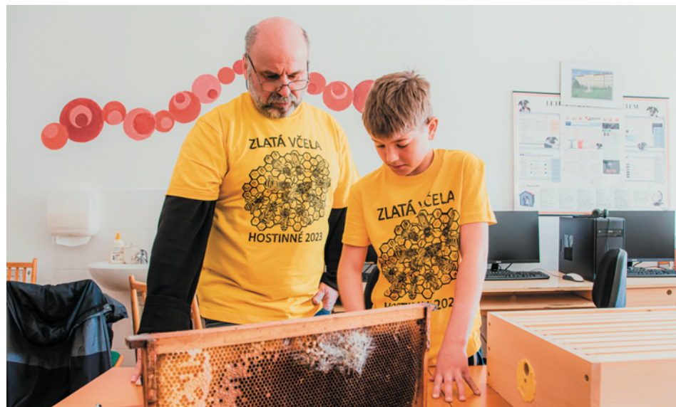
Poznávání škůdců včely medonosné

V sobotu 22. 4. se v Hostinném uskutečnilo oblastní kolo soutěže Zlatá včela pro Královéhradecký kraj. Celkem 22 členů tří včelařských kroužků – z Černilova, Dubence a Hostinného – se sešlo v budově Domu dětí a mládeže, aby navzájem poměřili své teoretické znalosti i praktické dovednosti týkající se včel a včelaření. Čekal je náročný vědomostní test s 30 otázkami (pár příkladů naleznete na konci článku), praktické poznávání deseti včelařských významných rostlin (ve starší kategorii navíc mladí včelaři museli znát, zda jsou pro včelu zdrojem pylu, nektaru, či medovice), určení názvu a funkce deseti užívaných včelařských pomůcek, poznání pěti částí včelího těla v mikroskopu a popsání jejich funkce a nakonec i praktická práce s včelími fotorámky, poznávání včelích škůdců a původců onemocnění.