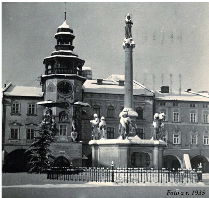
Foto z r. 1935