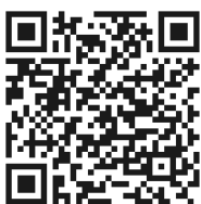
QR kód pro Android

Aplikaci Česká Obec stahujte buď přes Google Play, nebo App Store.