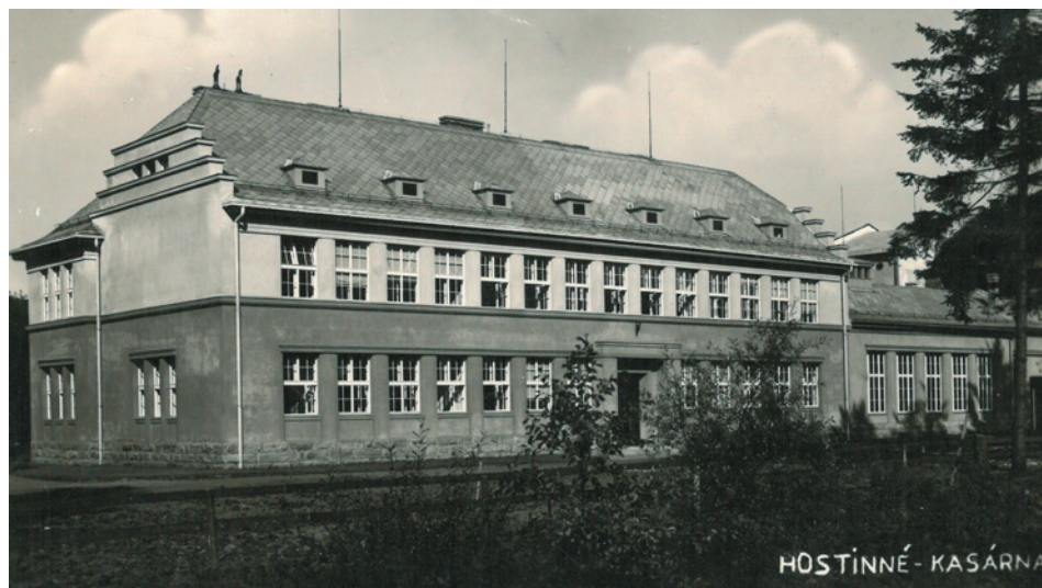
Budova školy pro důstojníky z povolání v Hostinném, foto z roku 1946

a vzdělávání v tomto oboru. V době svého založení v Hostinném to byla první škola svého druhu v osvobozené republice. Ke studiu a novému získávání znalostí byli přijímáni nejen rotmistři, ale i nově jmenovaní důstojníci. Přednostně však byli přijímáni ti, kdo se se zbraní v ruce zúčastnili bojů za svobodu v období okupace v letech 1939 - 1945, bez rozdílu zda na východní nebo západní frontě.