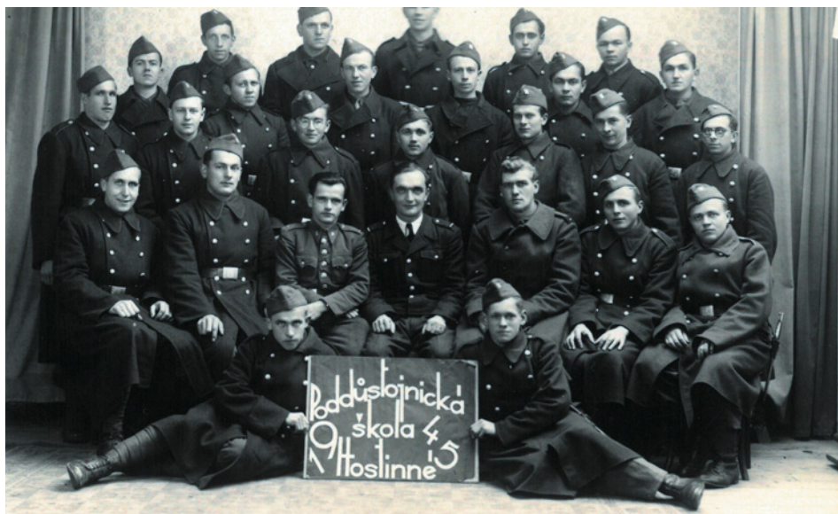
Absolventi školy pro důstojníky z povolání v Hostinném