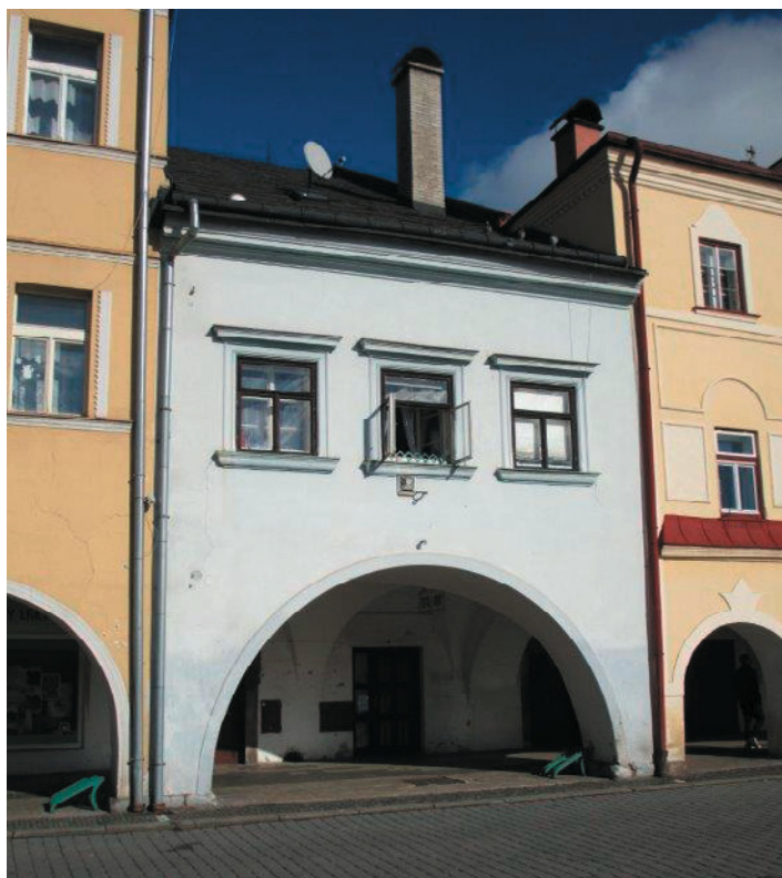
Dům č.p. 22 na Náměstí, sídlu rodiny baronů von Rosenfeld v Hostinném