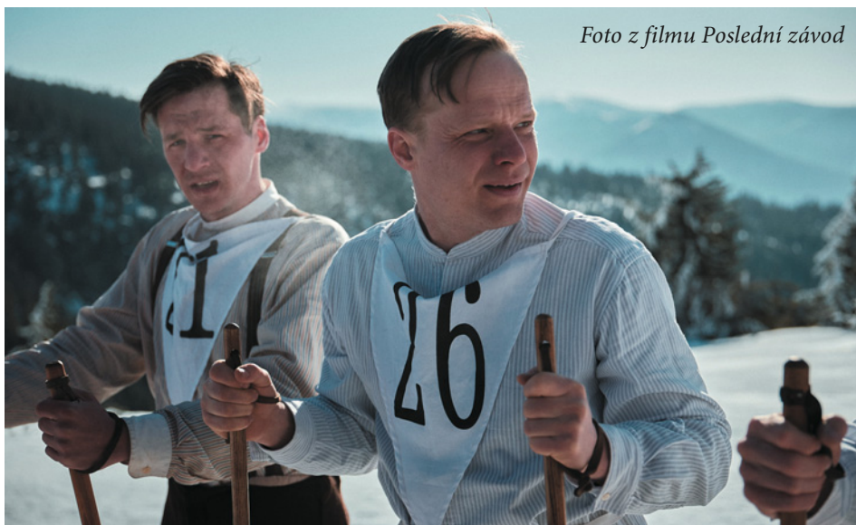
Foto z filmu Poslední závod