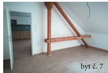
byt č. 7