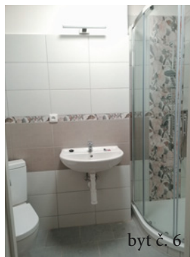
byt č. 6

Prohlídka bytů proběhne 1. 2. 2022 od 13:30 do 15:00 hod. Termín pro podání nabídek je do 7. 2. 2022 do 10:00 hod.