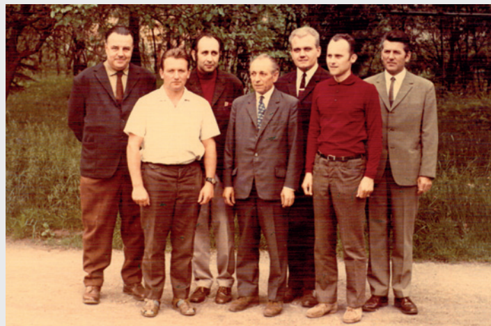
Profesorský sbor SPŠP ve školním roce 1970–1971