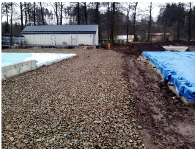
Úprava plochy kolem bazénů – podklad ze štěrku