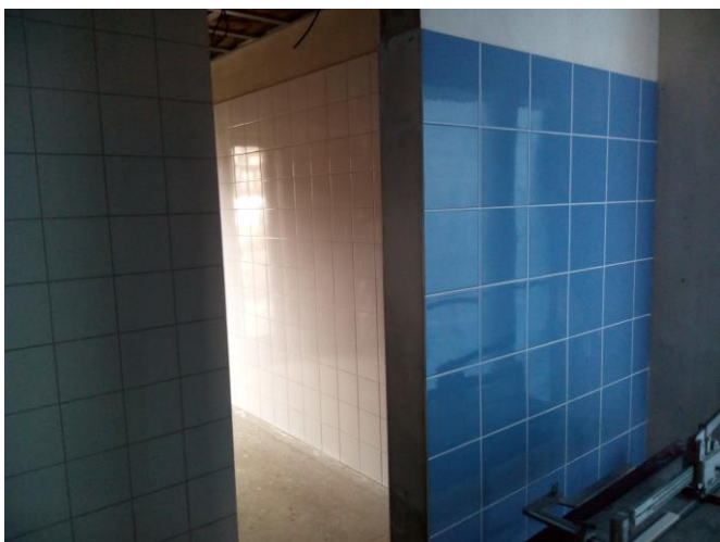
Provádění obkladů stěn – muži