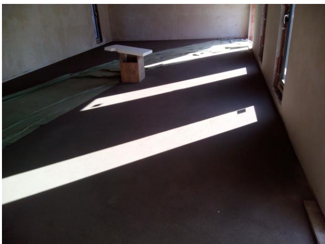
Podlahy po betonáži - šatna