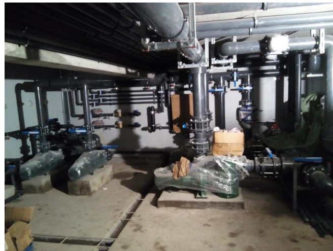
Montáž technologie bazénů