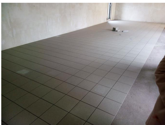
Obklad podlahy - šatna