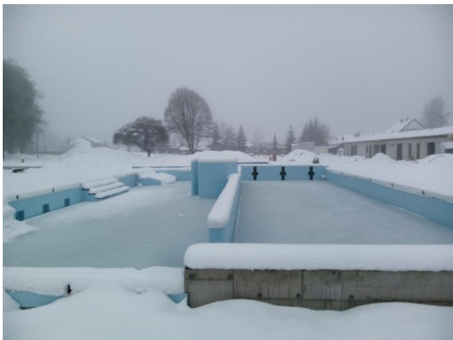
Koupaliště v zimě