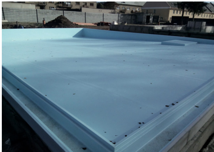
Bazén pro neplavce