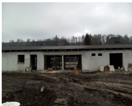
Dokončení zastřešení vstupu