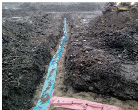
Rozvody vody a elektro