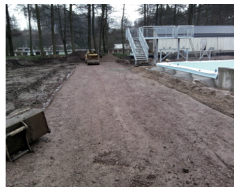
Konstrukce skluzavky a úpravy kolem bazénů