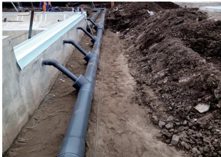
Rozvody bazénové vody