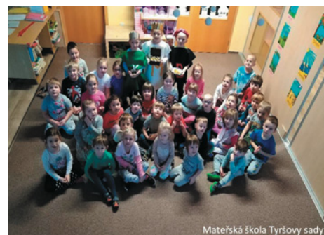
Mateřská škola Tyršovy sady

Tímto pěkným zvykem jsme se rozloučili s dobou vánoční.