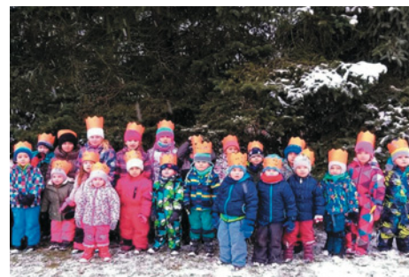
Mateřská škola A. Dvořáka

Každoročně se s dětmi ze všech mateřských škol v Hostinném vydáváme na tříkrálový pochod. Kašpar, Melichar a Baltazar spolu se svou družinou nesou zlato, kadidlo a myrhu a s betlémskou hvězdou se vydávají po budově MŠ a dále do města, kde rozdávají radost. S přáním všeho dobrého do nového roku si společně zazpíváme tříkrálovou koledu.