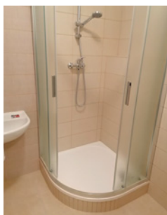
byt č. 1

Termín pro podání nabídek je do 11. 12. 2020 do 10:00 hod.