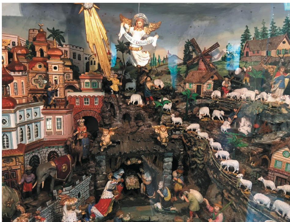
Skříňkový betlém z řezbářské dílny rodiny Russů v Čermné, vyrobený pro děkanský kostel v Hostinném, 2. polovina 19. století (Františkánský klášter Hostinné).