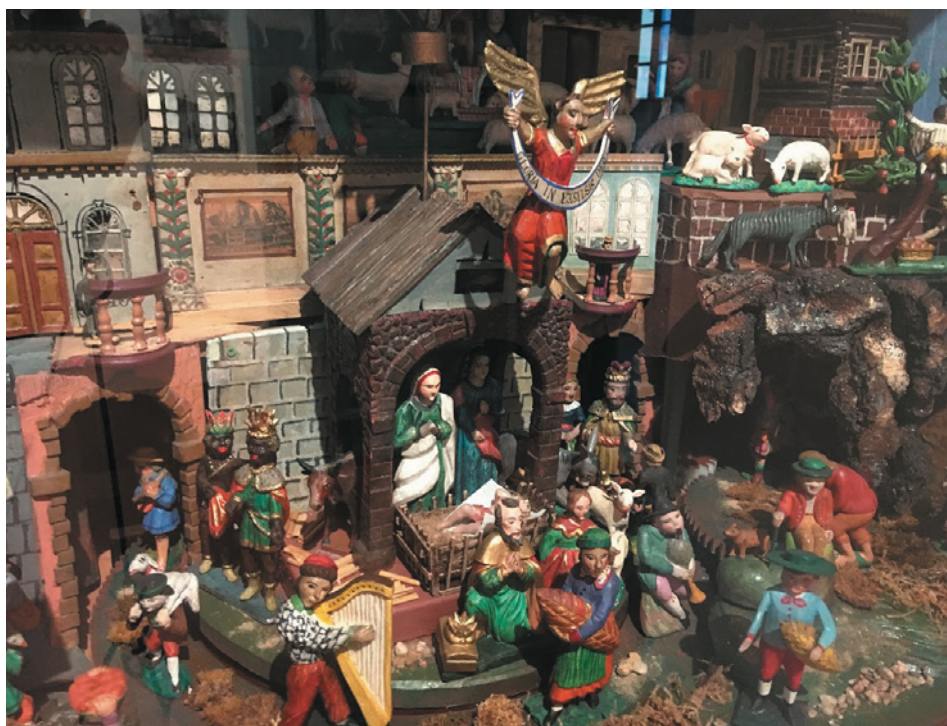
Skříňkový mechanický betlém ze starého muzea v Hostinném, autor neznámý, konec 19. století (Františkánský klášter Hostinné)

čen, že i toto téma patří neodmyslitelně do pestré mozaiky historie našeho města, a proto se vám následujícími řádky pokusím alespoň částečně přiblížit umění starých řezbářů a krásu jejich lidových betlémů v naší oblasti.