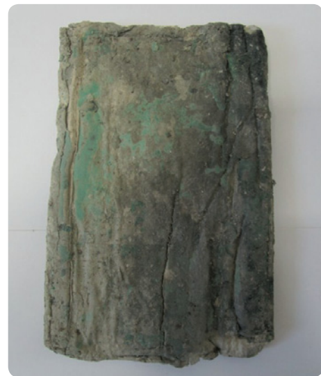
Vlhkostí a plísněmi znehodnocená listina nalezená uvnitř schránky

A co nalezená schránka ve svém nitru skrývala? Jak již bylo zmíněno, schránka byla vyrobena v roce 1867 a opakovaně pro uložení zprávy použita i o čtyřicet let později. V roce 1907 však nebyly spoje příliš dobře zaletovány. Svoji roli zajisté sehrálo i nešťastné umístění schránky v horní části dómu mariánského sloupu, kde se v zimě drží sníh a led, a vlhké prostředí způsobilo prorezavění části pravého boku, kde vznikl otvor o velikosti přibližně 0,5 cm. Vlhkost a následná plíseň tak zcela zničily i obsah schránky, kterým byla listina složená do tvaru obdélníku o velikosti 19 × 11 cm. Poselství našich předků nám tak zůstane navždy utajeno.