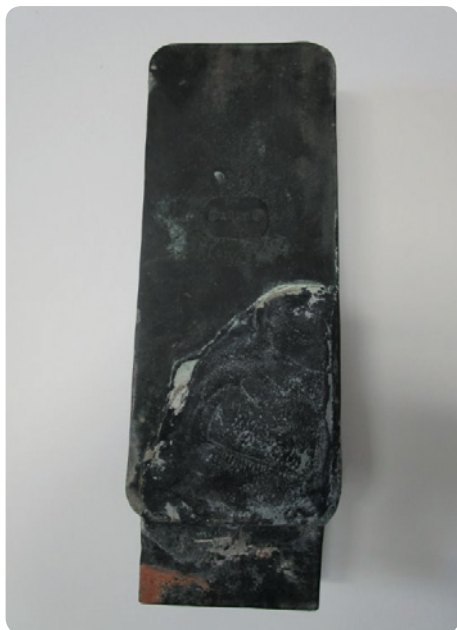
Plechová schránka z roku 1867, nalezená v horní části dómu mariánského sloupu