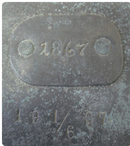
Detail datací (1867, 1. 6. 1907) na čelní straně schránky